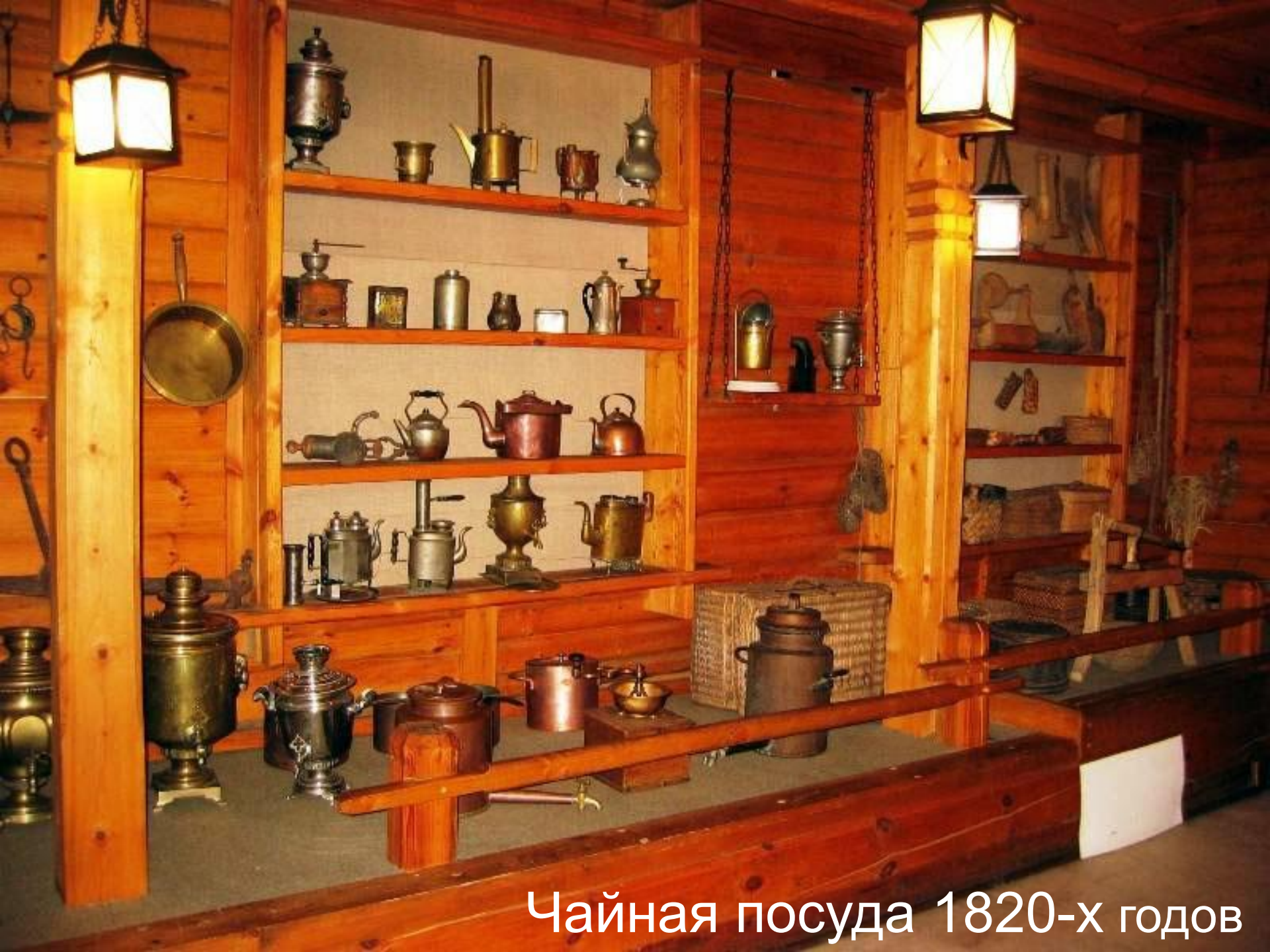
Чайная посуда 1820-х годов