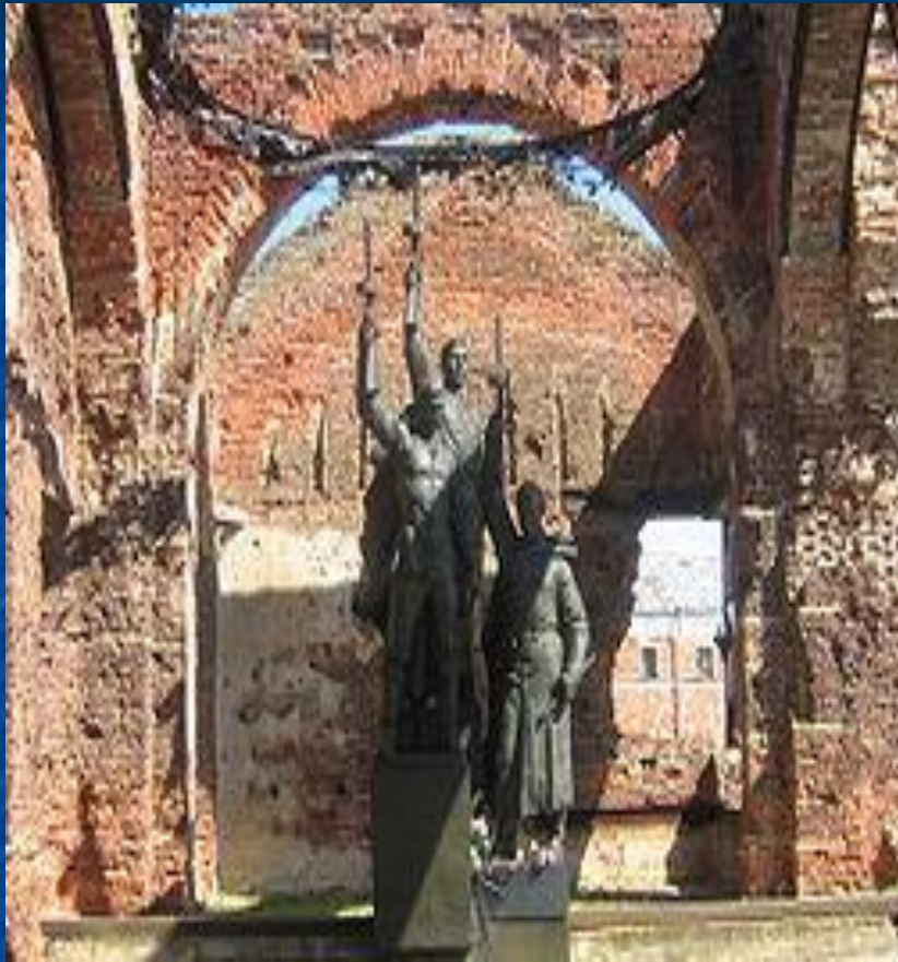
Памятник защитникам Орешка 1941—1943 гг.

В 1941—1943 гг. в течение 500 дней небольшой гарнизон оборонял крепость от немецких захватчиков. Фашистским войскам не удалось переправиться на правый берег Невы и замкнуть кольцо блокады, благодаря гарнизону крепости удалось защитить дорогу жизни.