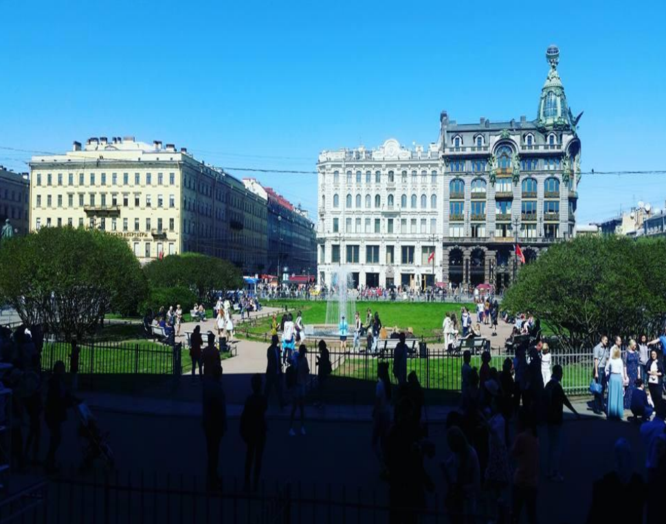
Петербург, Марсово Поле. 8 мая 2016 года.