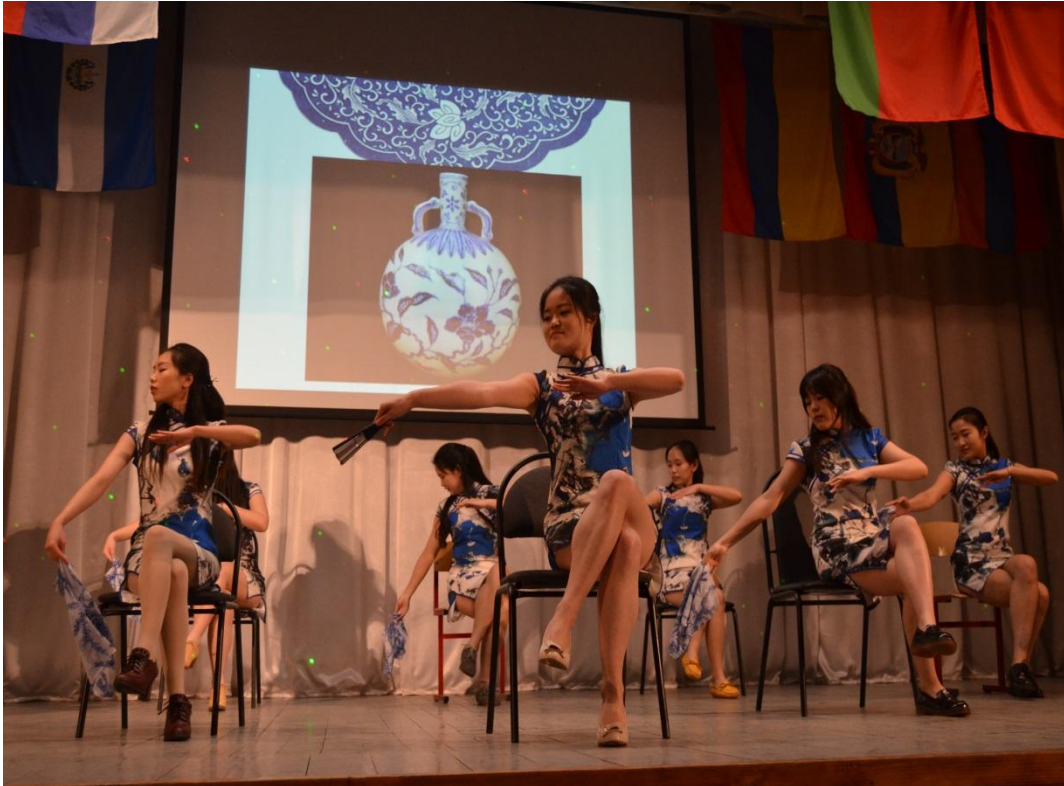
Танец «Бело – голубой фарфор». Исполняют студентки Яньчэнского университета. 2016 год.