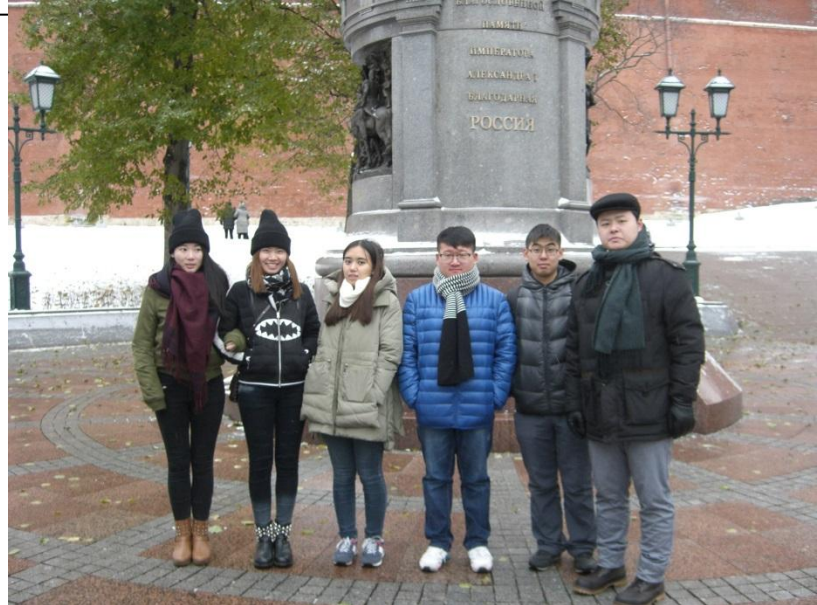
Экскурсия в Оружейную палату Кремля. Александровский сад. Новый памятник Владимиру – крестителю Руси