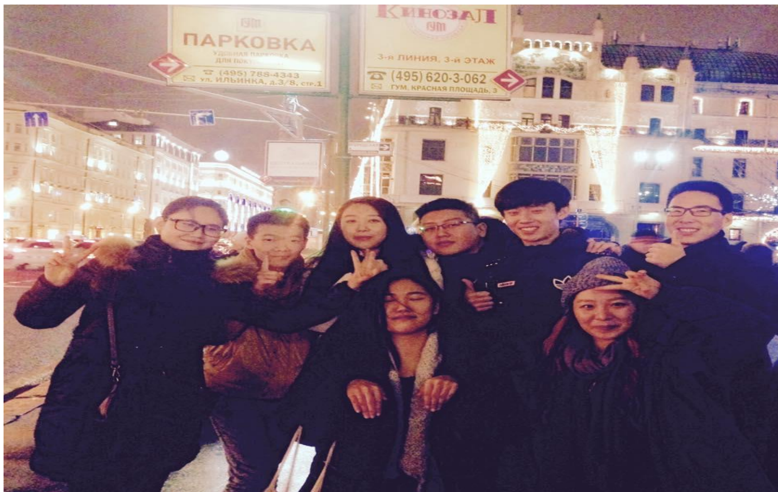
Ночная предновогодняя Москва. 30 декабря 2015 года.