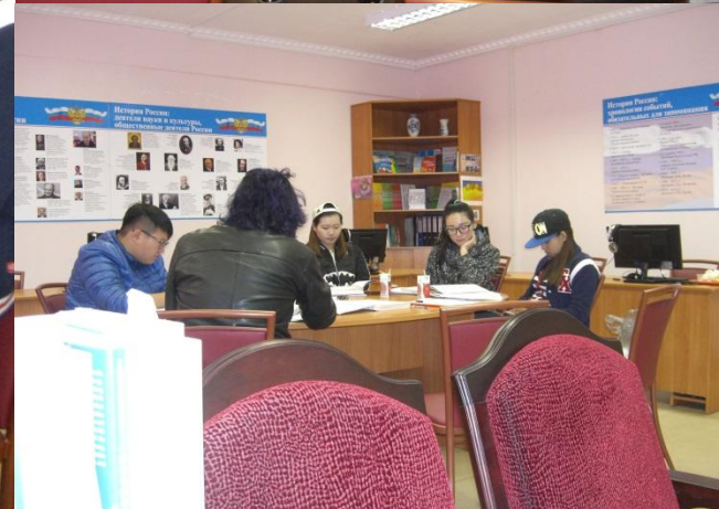
Студенты из Цицикарского университета , сентябрь 2016 года. Первые дни в ГГТУ.