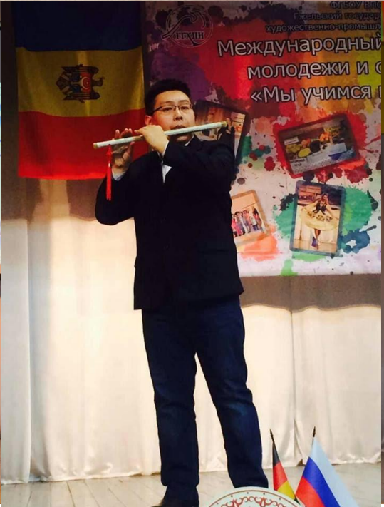
Гжель ГГУ .Фестиваль молодежи и студентов «Мы учимся в России». Декабрь 2015 года.