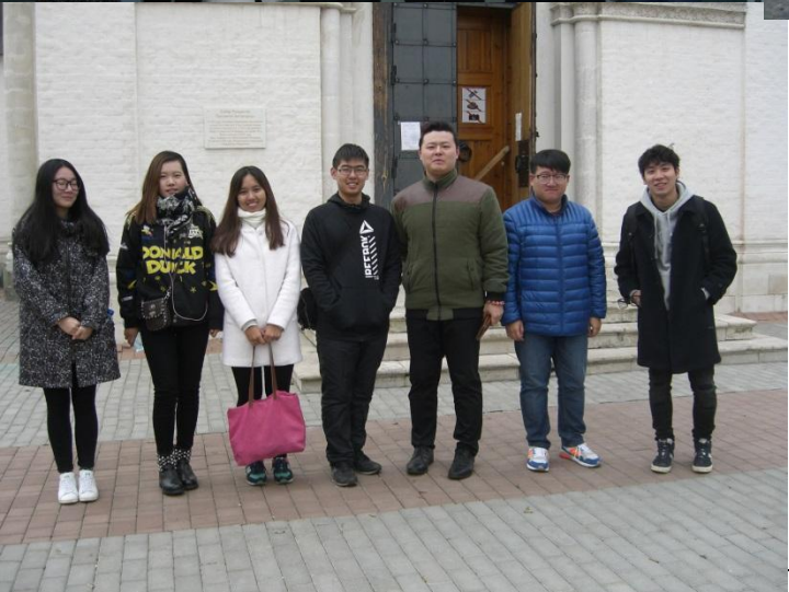
Экскурсия во Владимир. Октябрь 2016 года.