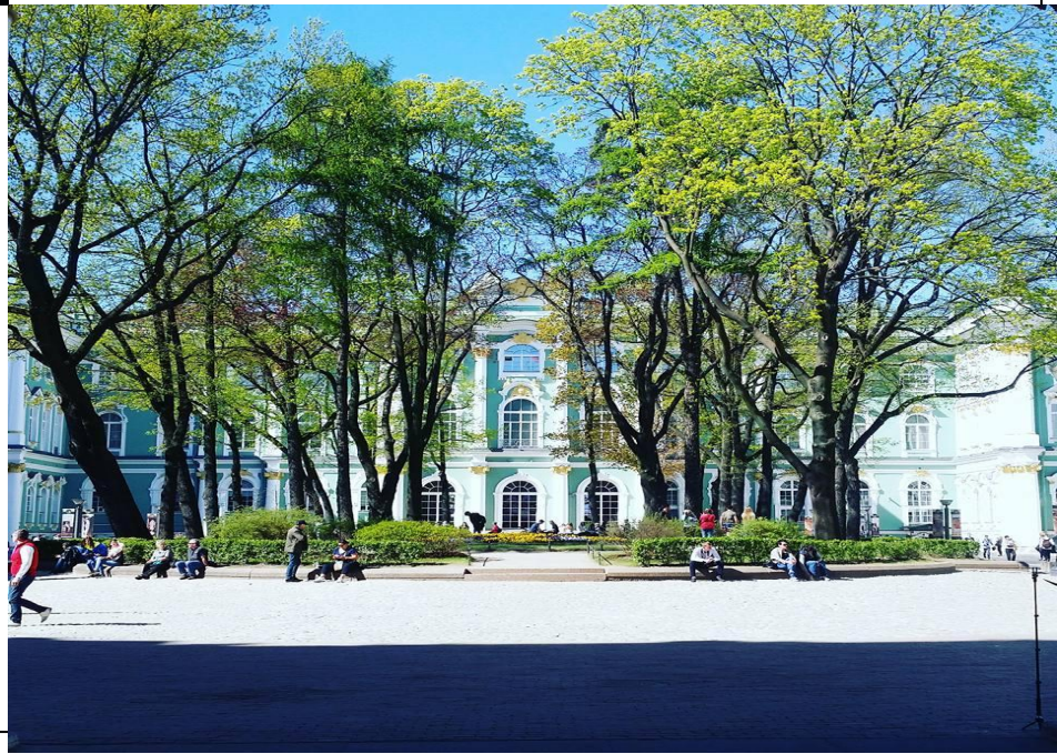
Сквер у входа в Эрмитаж.