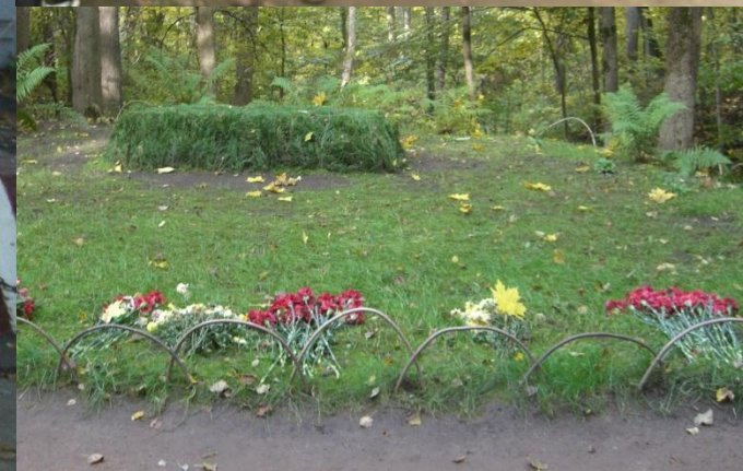
Октябрь 2016 года. Экскурсия в г.Тулу и имение Л.Н. Толстого «Ясная Поляна»