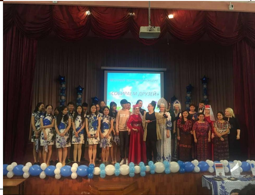
Фотография на память после фестиваля