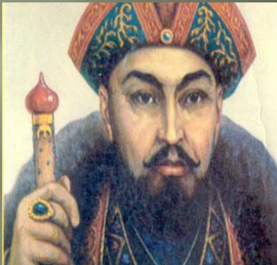
Абылай хан 1711-1781 жж