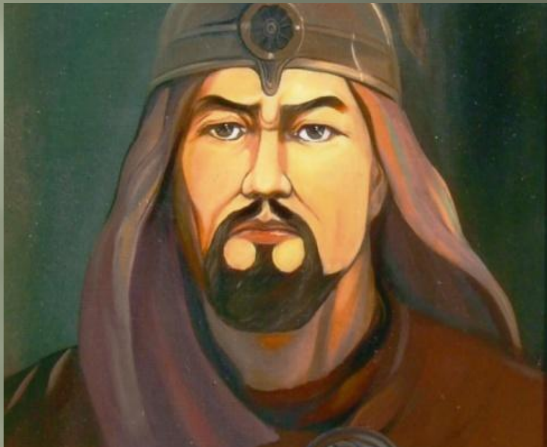
Батыр Баян 1704-1757 жж