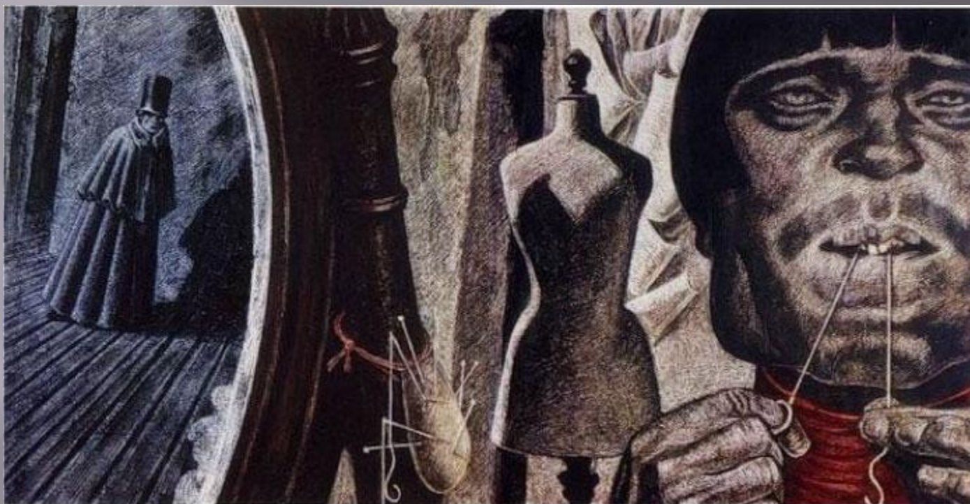
Бродский С. К портному. Иллюстрации к повести Н.В. Гоголя «Шинель», 1970. http://www.liveinternet.ru/users/rinagit/