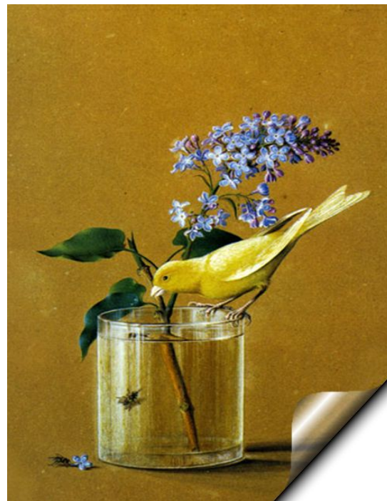
Ветка сирени и канарейка