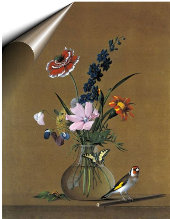
Букет цветов, бабочка и птичка