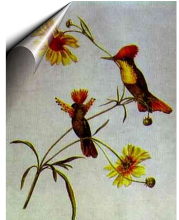
Птицы и цветы