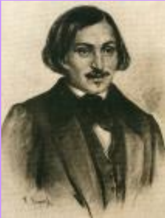
Николай Васильевич Гоголь (1809 – 1852)