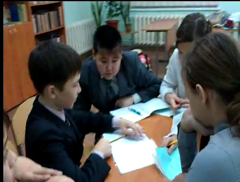
444 Памятка тому, кто пишет сочинение