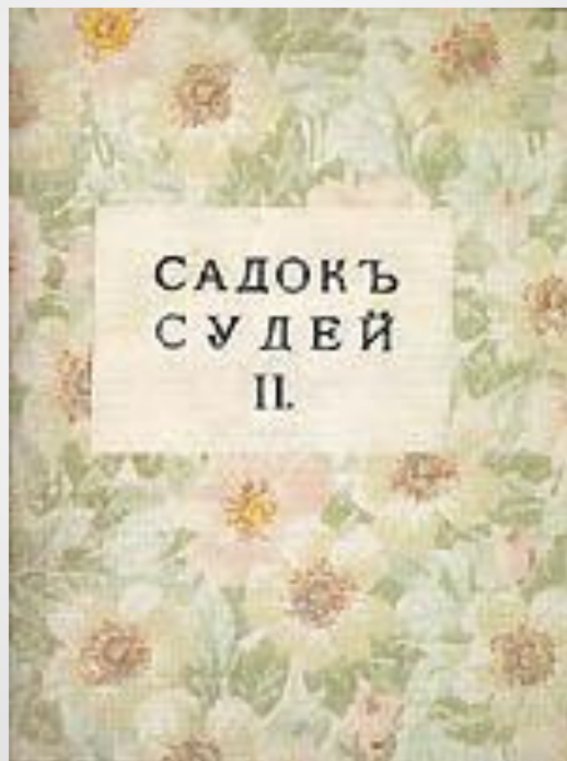
Садок Судей II СПб, 1913 обложка

Временем рождения русского футуризма считается 1910 год, когда вышел в свет первый футуристический сборник «Садок Судей», его авторами были Д.Бурлюк, В.Хлебников и В.Каменский.