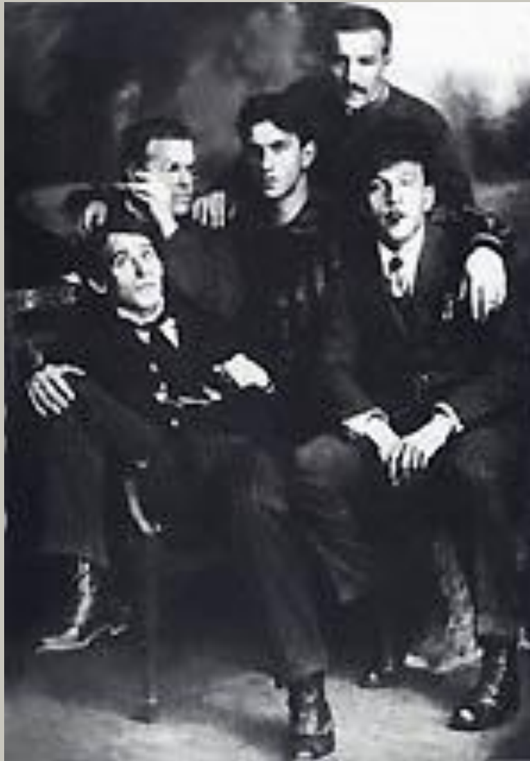
Футуристы А. Крученых, Д. Бурлюк, В. Маяковский, В. Бурлюк и Б. Лифшиц. Петербург, 1912 (слева направо)