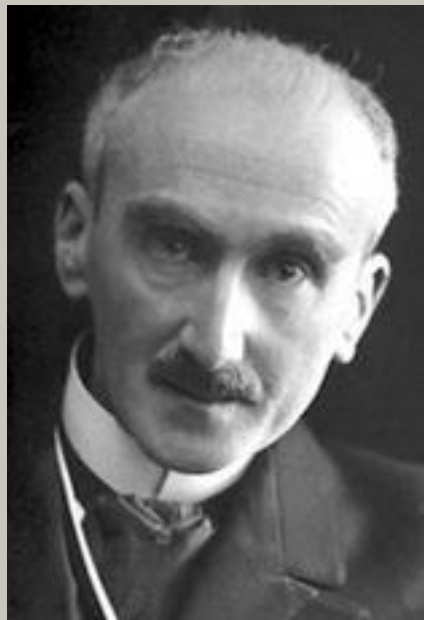
Анри Бергсон (французский философ)

Русский футуризм связан с западноевропейской культурной традицией – философскими идеями А.Бергсона, А. Шопенгауэра, Ф.Ницше, провозглашавшими интуитивизм (познание действительности, основанное на интуиции), нигилизм, критику традиционной культуры, идеал «сверхчеловека», свободного от каких-либо моральных ограничений