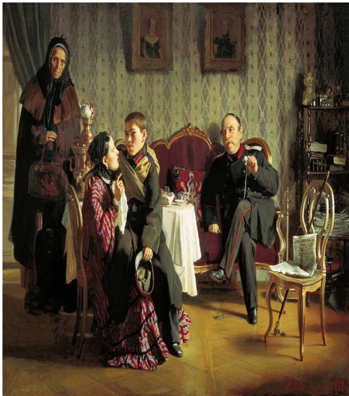
Корзухина А.И. «Разлука»