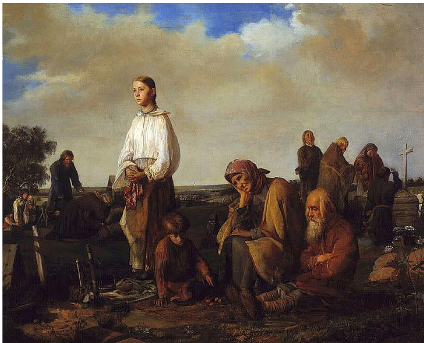
«Поминки на деревенском кладбище»