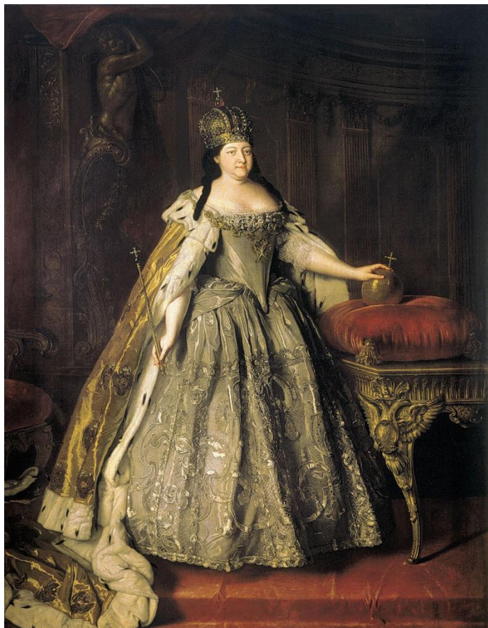
Иван Вишняков. Портрет Елизаветы Петровны. 1743г, холст, масло, Государственная Третьяковская галерея, Москва