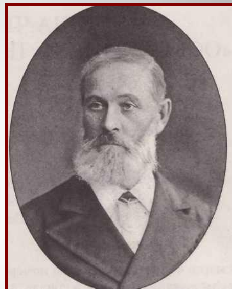
ПАВЕЛ ЕГОРОВИЧ ЧЕХОВ 1882 г.