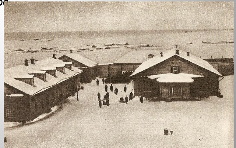
Сахалин. Воеводская тюрьма.