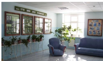
Рекреация II этажа