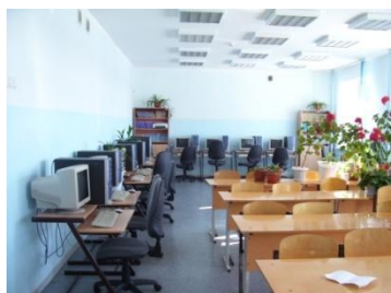
I компьютерный класс