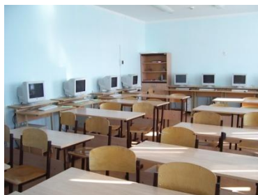
II компьютерный класс