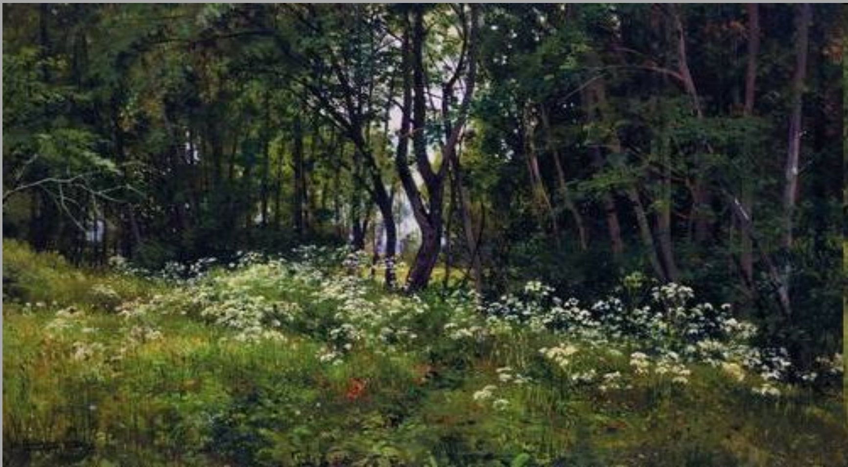
И.Шишкин. Цветы на опушке леса