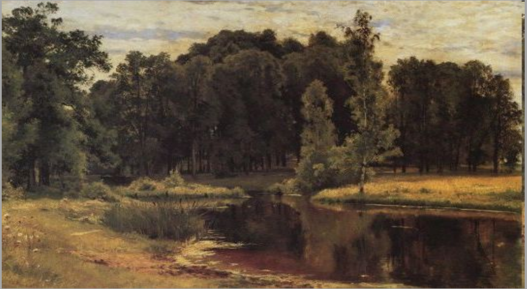
И.Шишкин. Пруд в старом парке