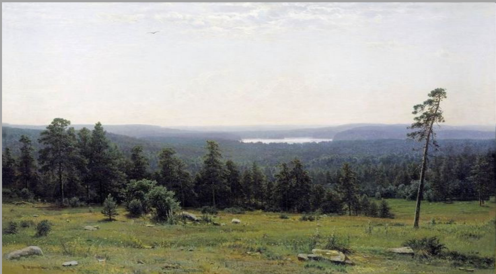
И.Шишкин. Лесные дали