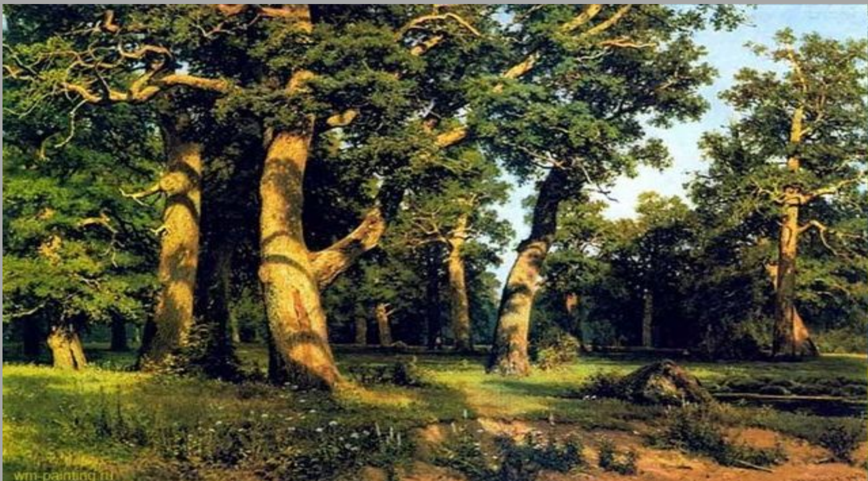
И.Шишкин. Дубовая роща