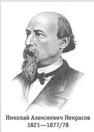
Николай Алексеевич Некрасов 1821—1877/78