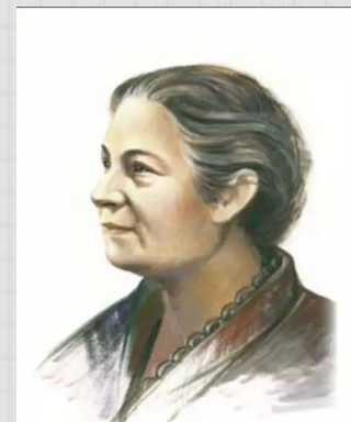
Барто Агния Львовна (17.02.1906-01.04.1981)