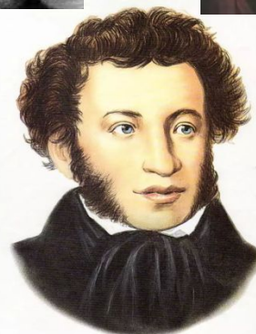
Пушкин Александр Сергеевич (1799-1837)