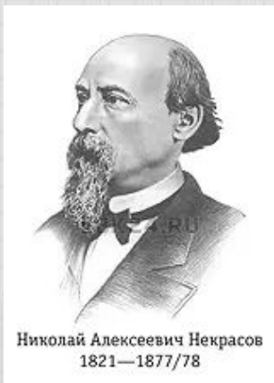
Николай Алексеевич Некрасов 1821—1877/78