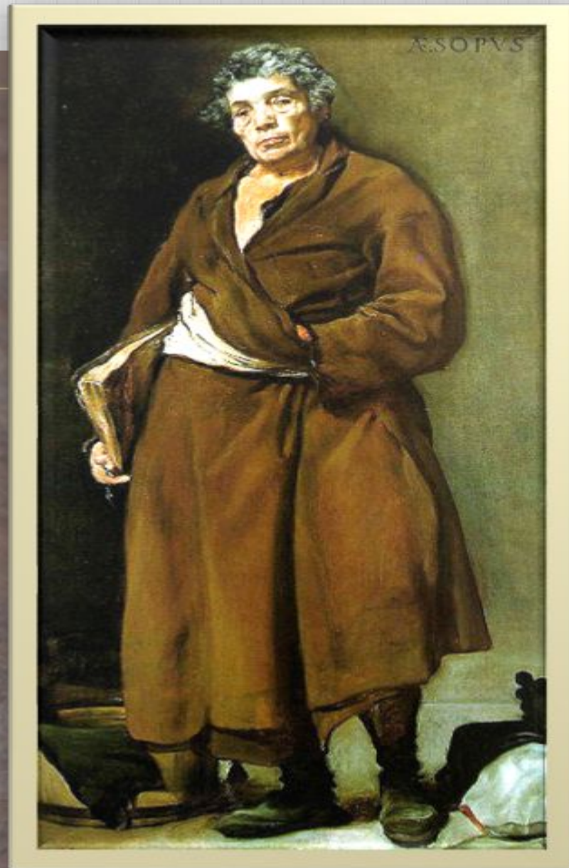
Картина Диего Веласкеса (1639 – 1640)

Эзоп не захотел терять свободу и выбрал смерть свободного человека.