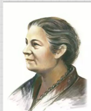
Барто Агния Львовна (17.02.1906-01.04.1981)