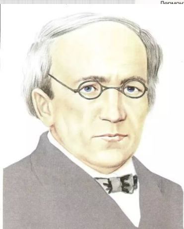
Тютчев Федор Иванович (1803-1873)