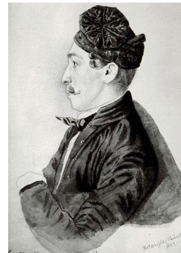
Убийца Лермонтова Николай Мартынов