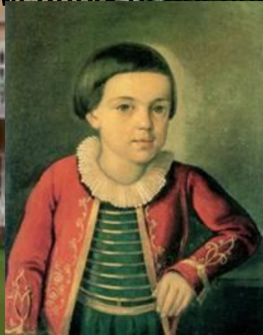
М. Ю. Лермонтов в детстве.