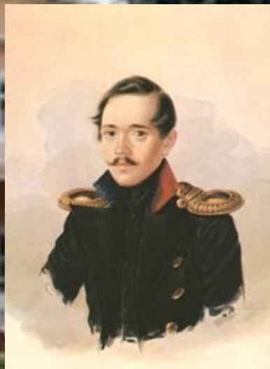
М.Ю.Лермонтов в сюртуке лейб-гвардии Гусарского полка.