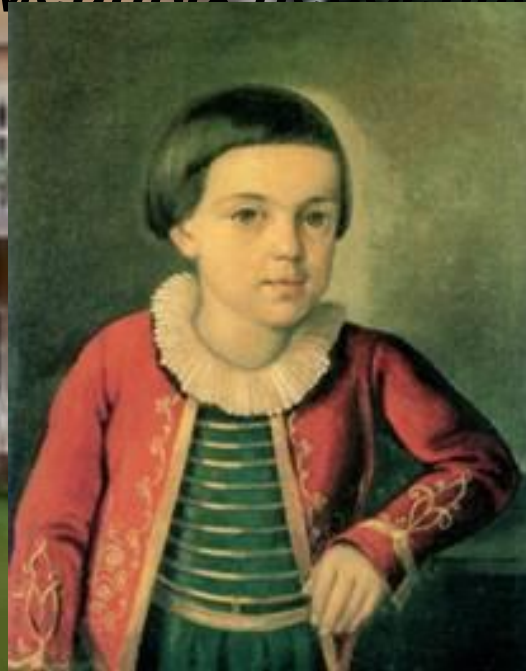
М. Ю. Лермонтов в детстве.