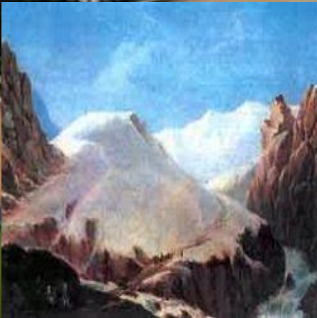
М. Ю. Лермонтов «Крестовая гора».

На Кавказе были написаны многочисленные произведения, в которых поэт признаётся в своей любви Кавказу.