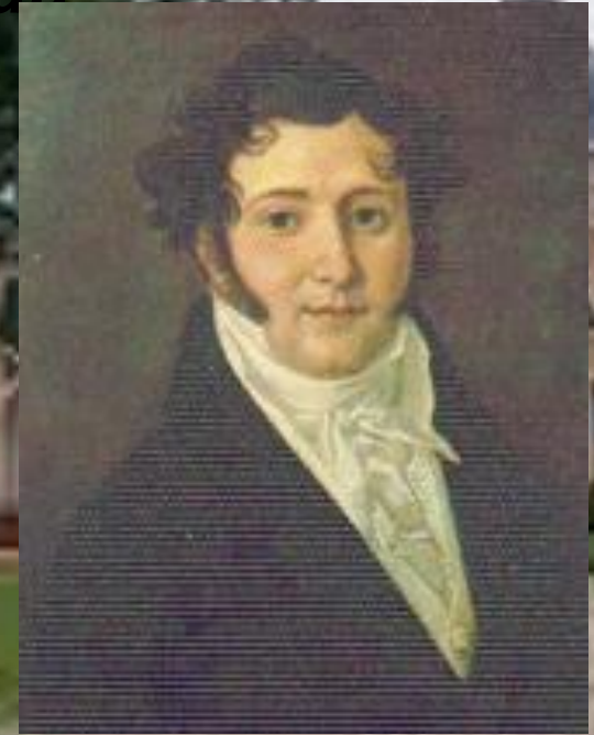
Ю. П. Лермонтов, отец поэта.