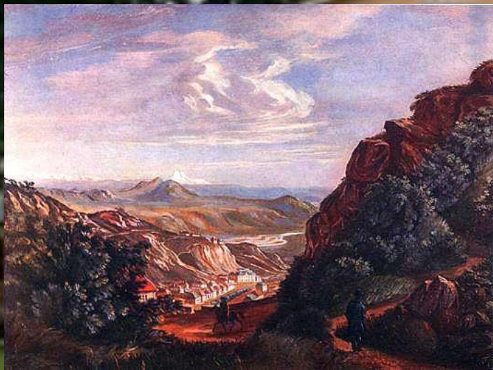
М. Ю. Лермонтов «Вид Пятигорска».

В 1840 году за дуэль с сыном французского посланника де Барантом М. Ю. Лермонтова вновь ссылают на Кавказ.