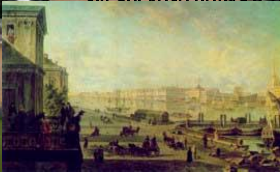
Петербург. 1820-е гг.

Оставив университет, Лермонтов в 1832 году переезжает в Петербург и поступает в Школу гвардейских подпрапорщиков и кавалерийских юнкеров; выпущен корнетом Лейб-гвардии эскадронного полка в 1834 году.