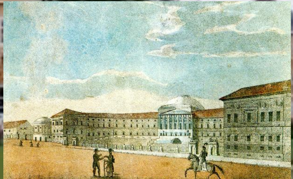
Московский университет. 1820-е гг.