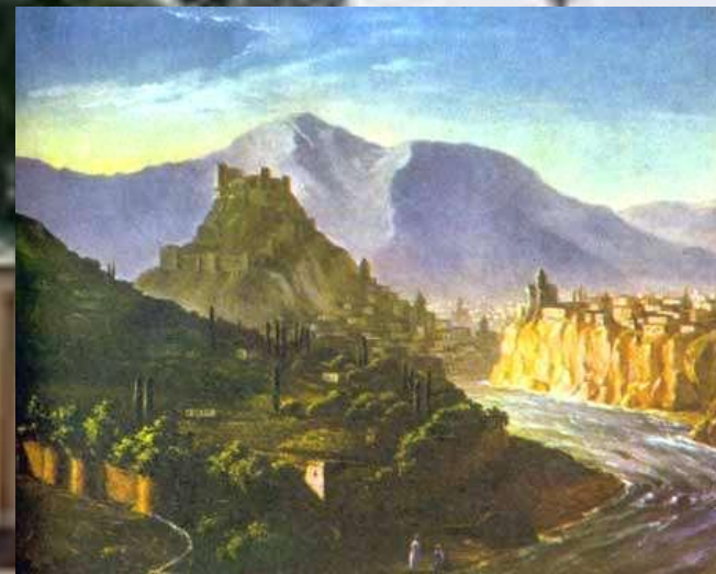
М. Ю. Лермонтов «Вид Тифлиса».