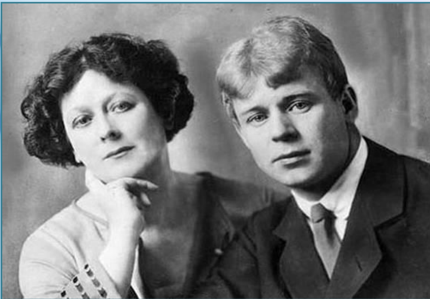
Сергей Есенин и Айседора Дункан 1923 г.