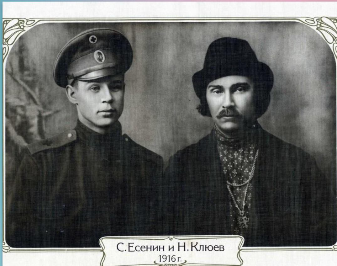
С.Есенин и Н.Клюев 1916г.

С детства слагавший стихи, Есенин обретает единомышленников в «Суриковском литературно-музыкальном кружке», членом которого он становится в 1912. Печататься начинает в 1914 в московских детских журналах (дебют — стихотворение «Береза»). Весной 1915 Есенин приезжает в Петроград, где знакомится с А. А. Блоком, С. М. Городецким, А. М. Ремизовым и др., сближается с Н. А. Клюевым, оказавшим на него значительное влияние. Их совместные выступления со стихами и частушками, стилизованными под «крестьянскую», «народную» манеру (Есенин являлся публике златокудрым молодцем в расшитой рубашке и сафьяновых сапожках), имели большой успех.