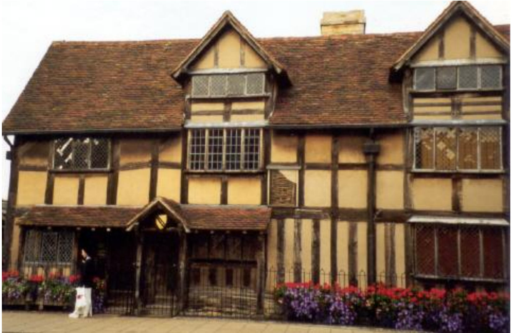
Дом, в котором родился Шекспир.