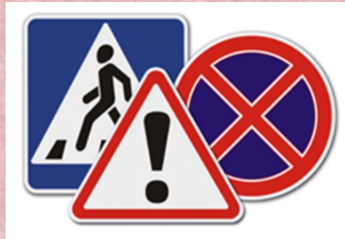
Язык дорожных знаков