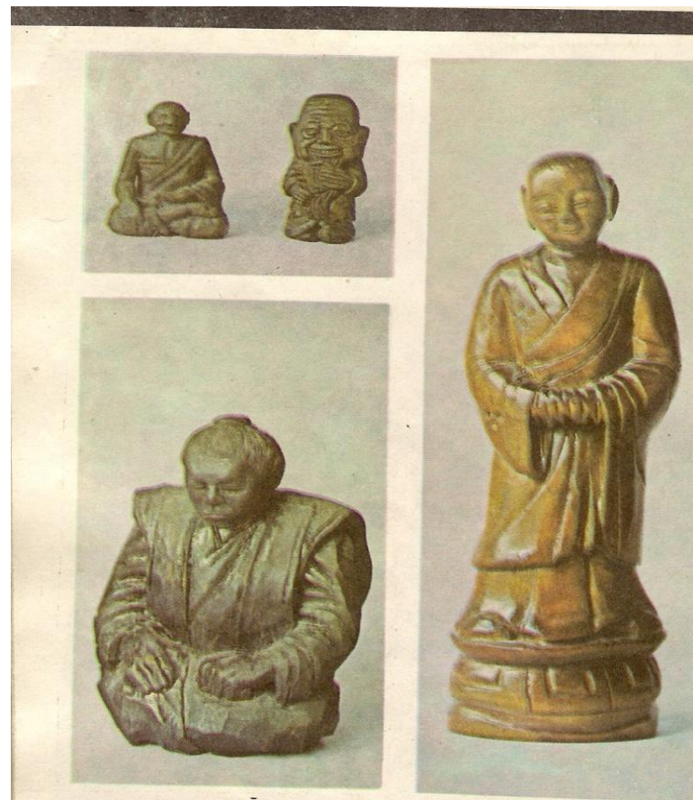
Нэцке работы Виктора Цоя

1986- работа в котельной, начало «Камчатки» (название котельной, где проходили концерты Цоя). «квартирники»- репетиции и концерты на квартирах.