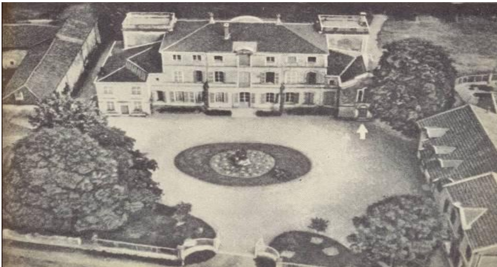
Замок Ла - Моль, в котором прошло детство Сент-Экзюпери