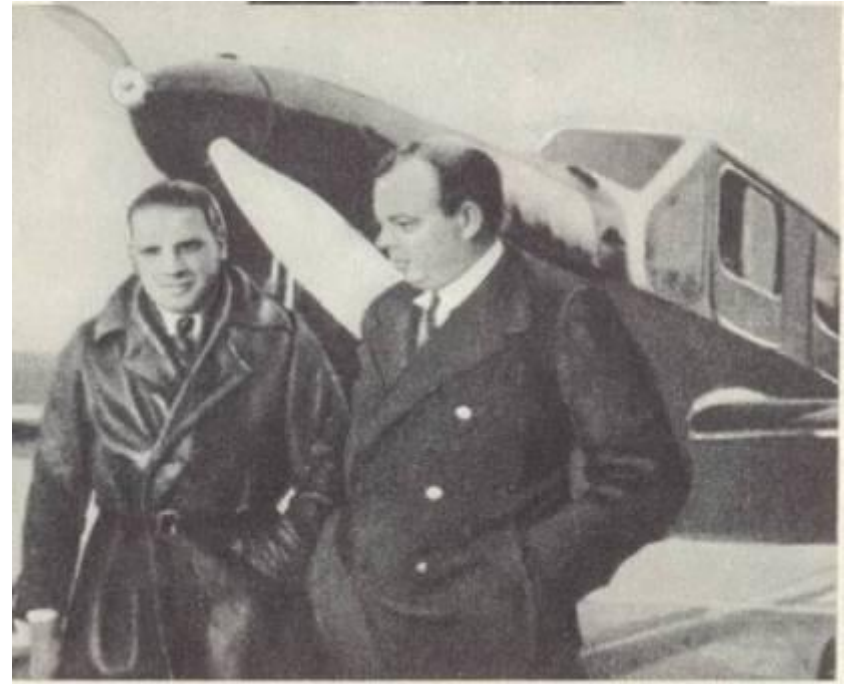
Сент – Экзюпери и его механик.

Впоследствии он скажет: «Пустыня? Однажды мне случилось заглянуть ей в сердце. В 1935 году я летел в Индокитай, а очутился в Египте, у рубежей Ливии, я увяз там в песках, как в смоле, и ждал смерти...»