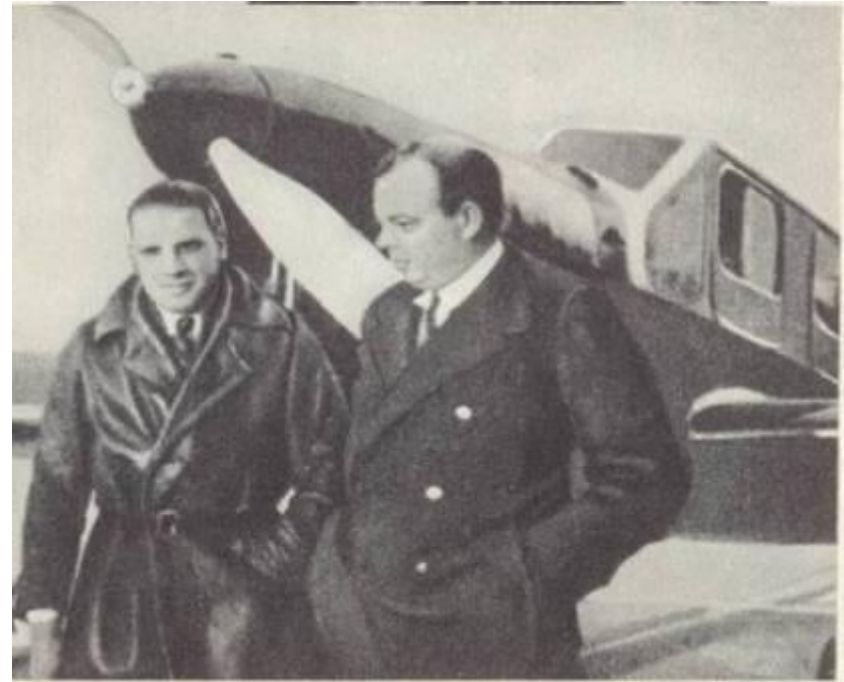
Сент – Экзюпери и его механик.

Впоследствии он скажет: «Пустыня? Однажды мне случалось заглянуть ей в сердце. В 1935 году я летел в Индокитай, а очутился в Египте, у рубежей Ливии, я увяз там в песках, как в смоле, и ждал смерти...»