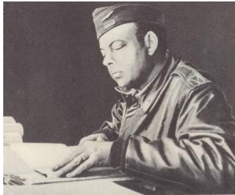
Сент – Экзюпери за работой.

По состоянию здоровья Экзюпери не смог нести военную службу, но он остался в военной разведке.