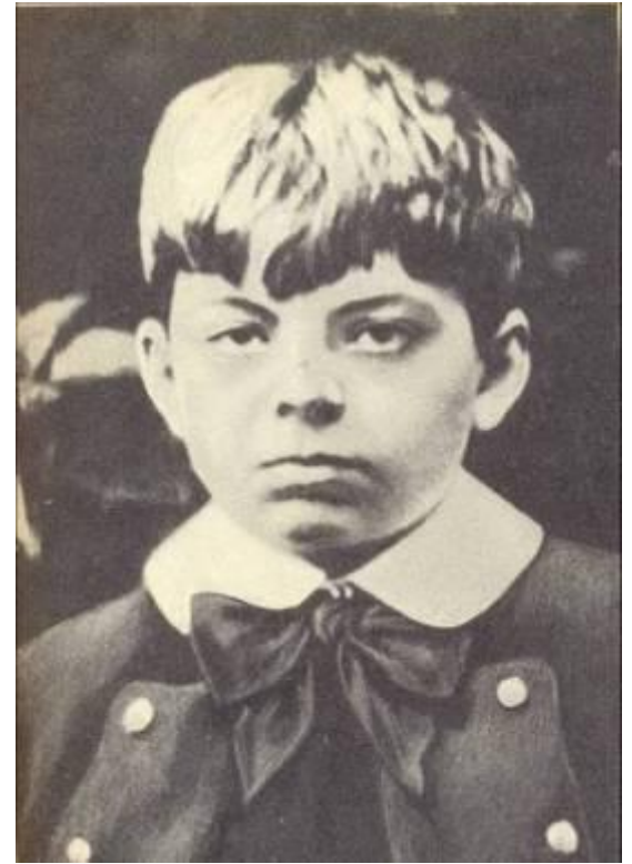
Антуану 7 лет

29 июня 1900 года в Лионе в семье инспектора страховой компании появился третий ребёнок, который, по обычаю католиков, получил сразу несколько имён: Антуан Жан-Батист Мари Роже де Сент-Экзюпери.