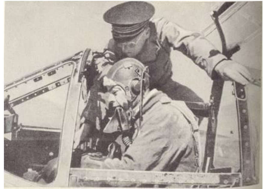
Сент – Экзюпери в самолете