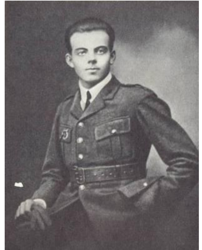
Антуан в форме военного летчика

Антуан де Сент - Экзюпери и его новое увлечение – самолёт-оказались созданными друг для друга.