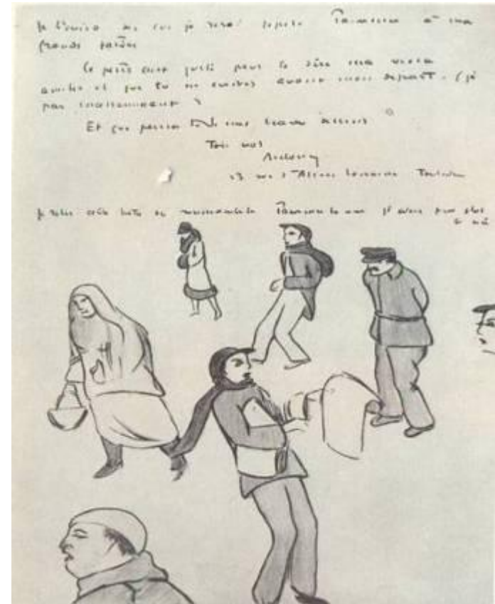
Письмо с рисунками Экзюпери

У Антуана - новое увлечение — он хочет стать художником. Блокнот за блокнотом он заполняет своими рисунками. Кроме того, Экзюпери, вероятно ещё и пишет, пока для себя.