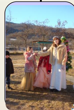
Интерес к личности каждого ребёнка