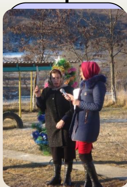
Инициатива и творчество