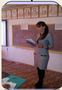
Выдержка и самообладание