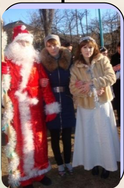
Любовь к детям