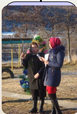
Инициатива и творчество