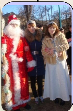
Любовь к детям