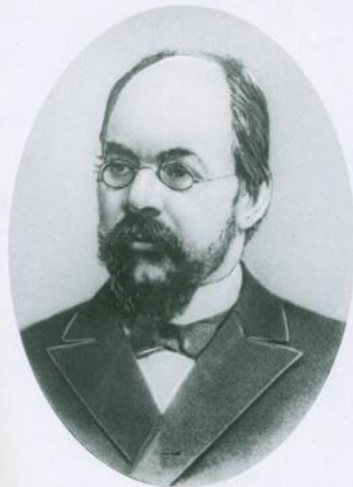
Иван Владимирович Цветаев. 1903.