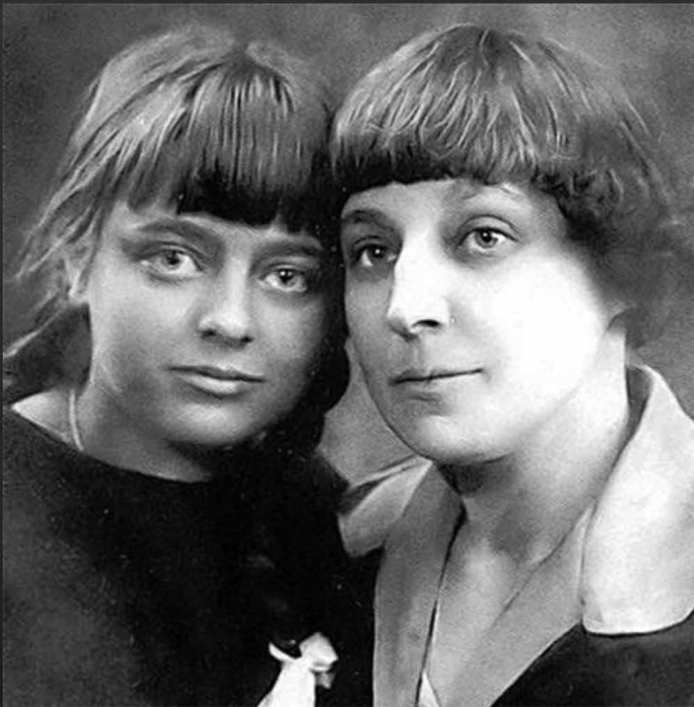
Марина Цветаева с дочерью Ариадной