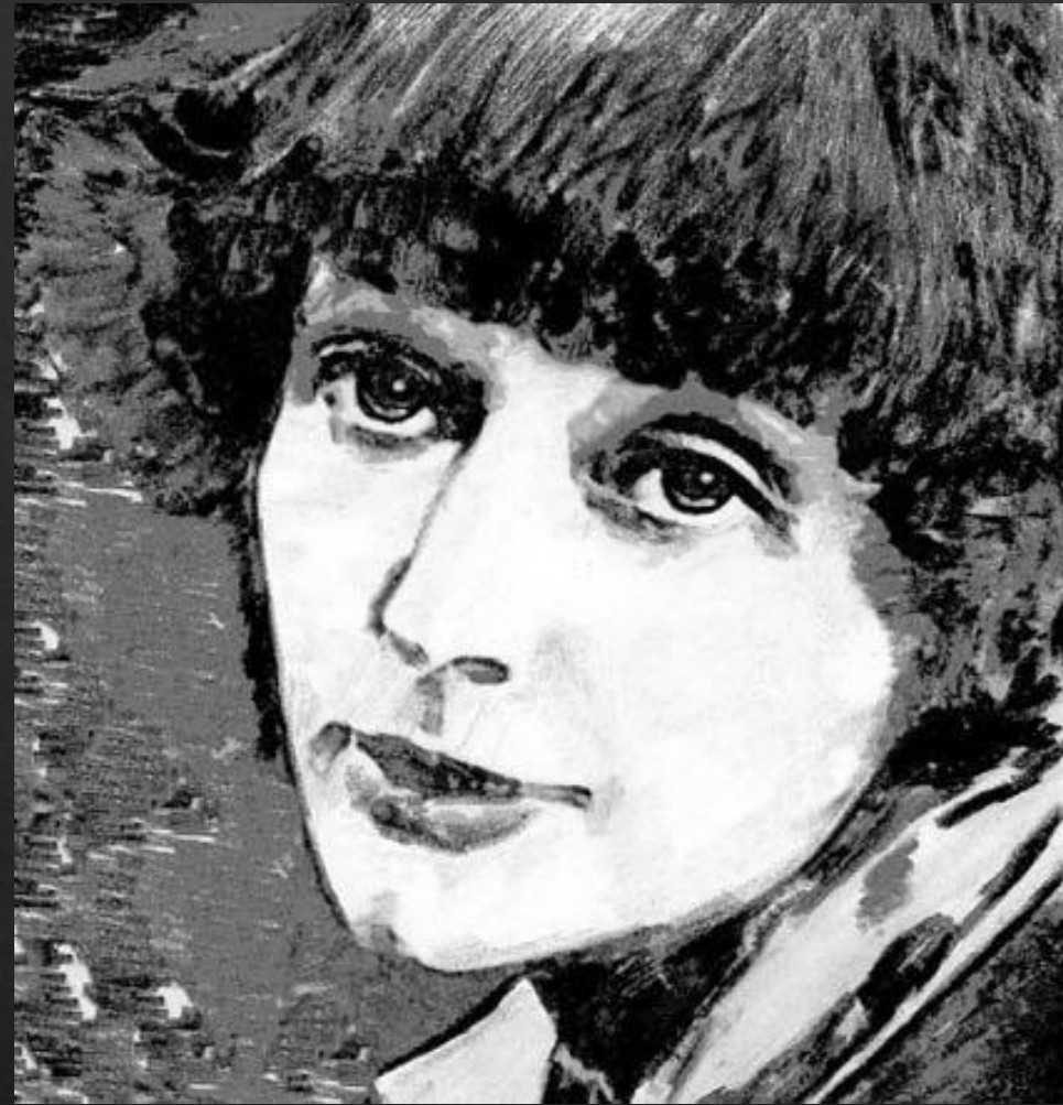
Марина Цветаева (1892 — 1941)