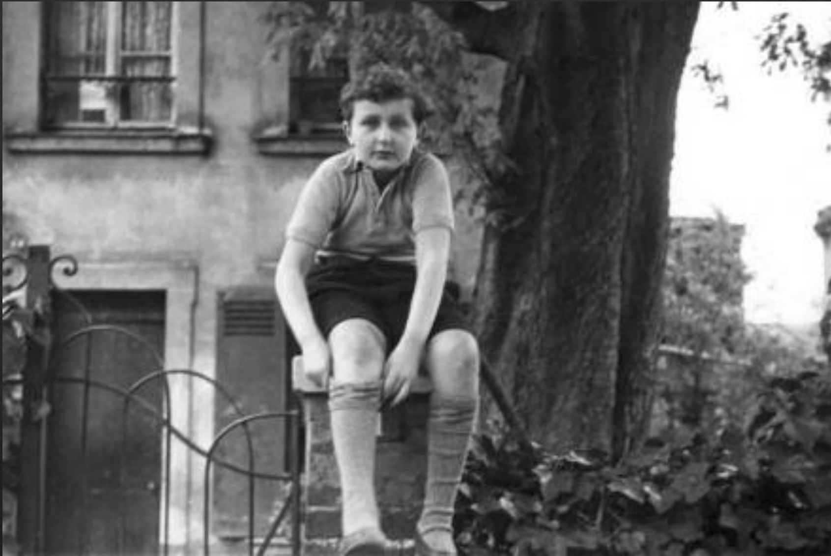
Мур (Георгий Сергеевич Эфрон), сын Марины Цветаевой Париж, 1930-е.