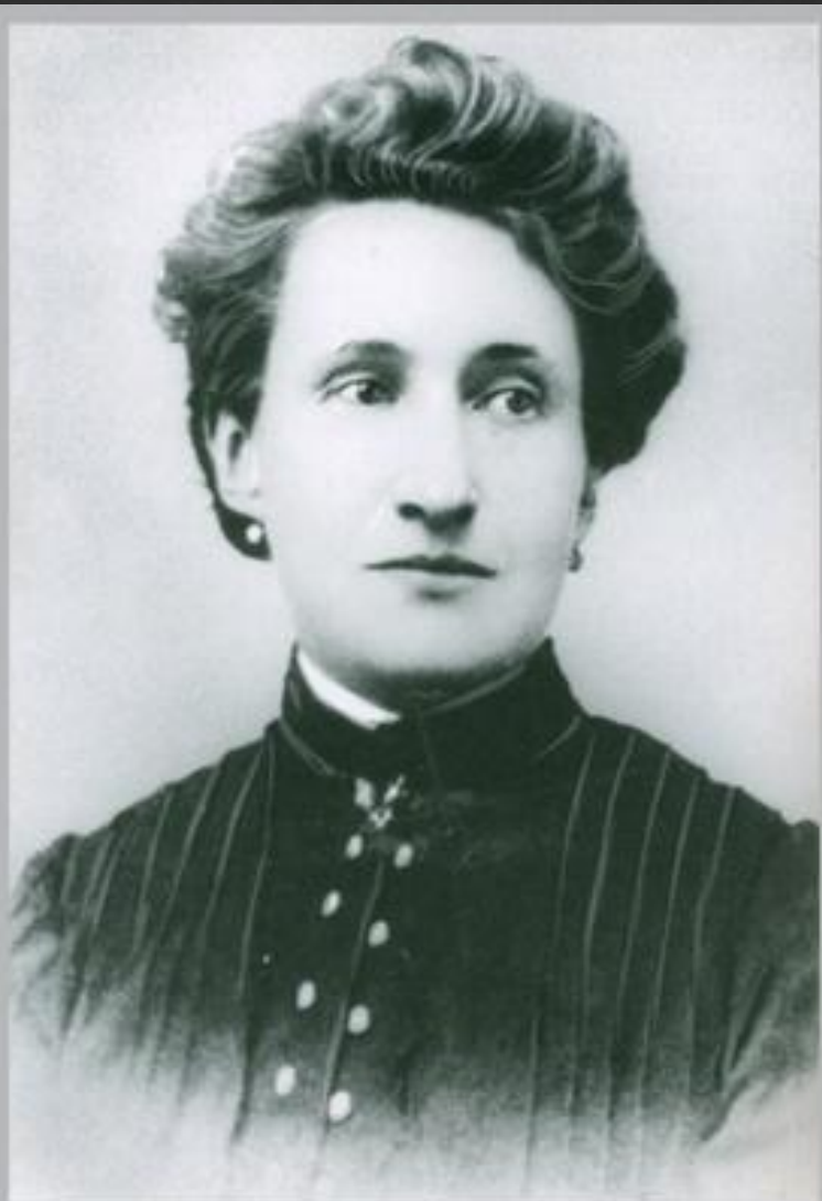
Мария Александровна Цветаева, урожденная - Мейн. 1903 г.