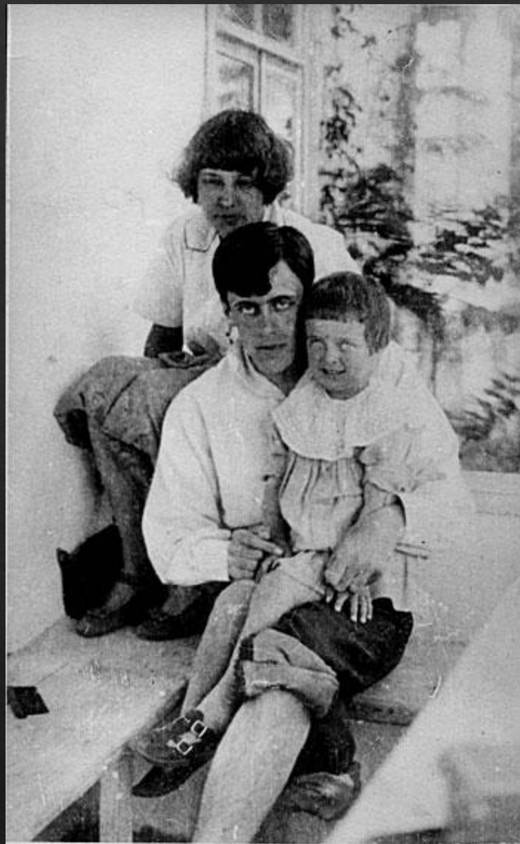
Марина Цветаева, Сергей Эфрон, Ариадна. 1916 г