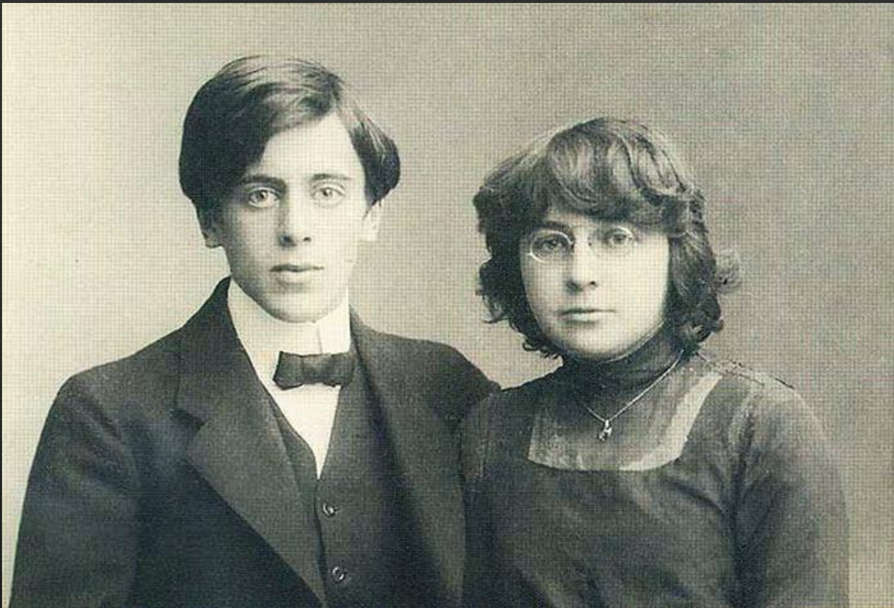
Сергей Эфрон и Марина Цветаева. Москва, 1911