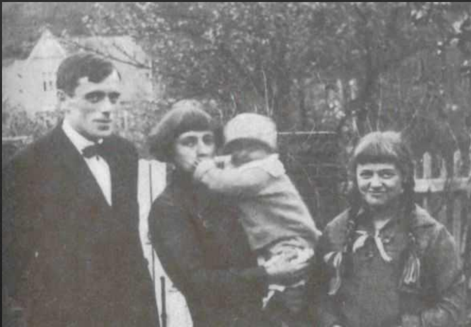
М.И. Цветаева с мужем и детьми. Прага, 1925 г.