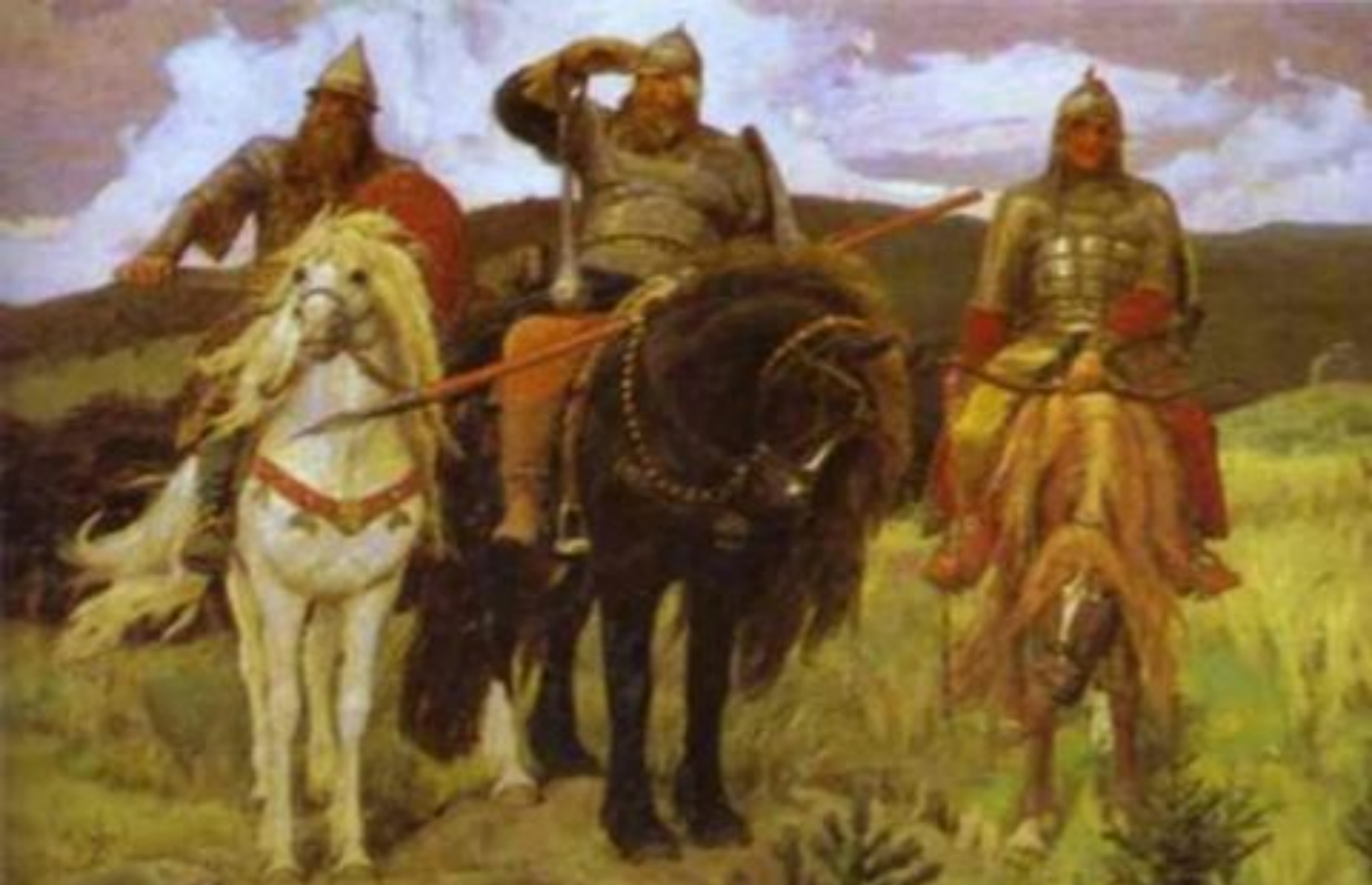
Картина В. Васнецова «Богатыри»