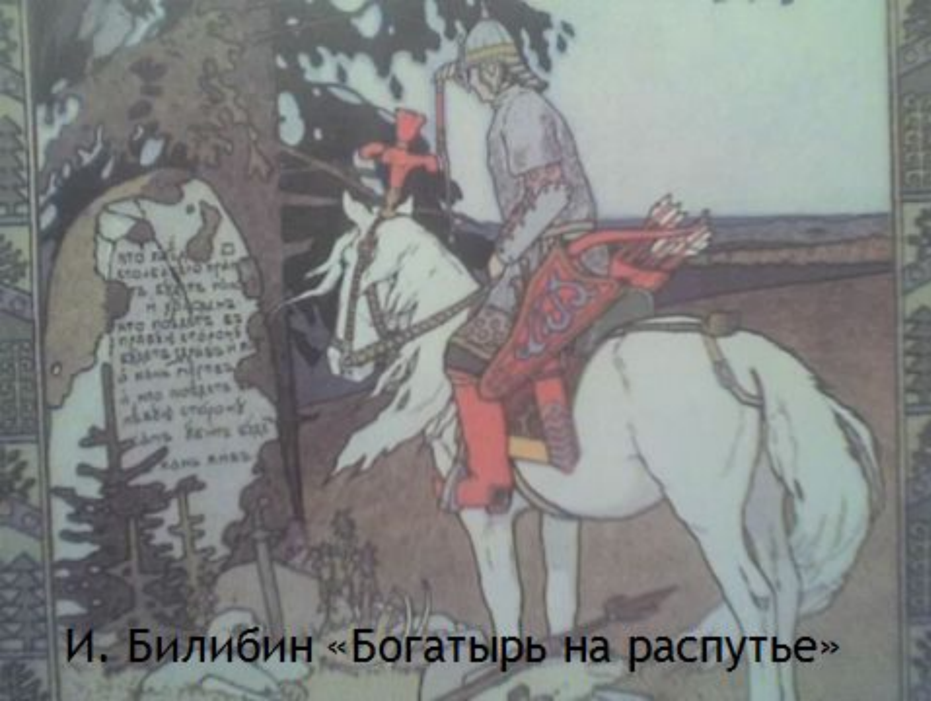
И. Билибин «Богатырь на распутье»