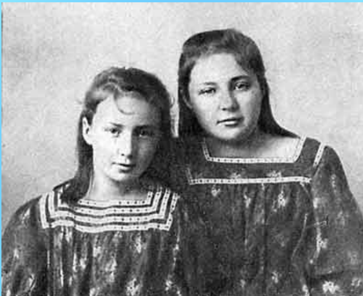
Марина и Анастасия Цветаевы