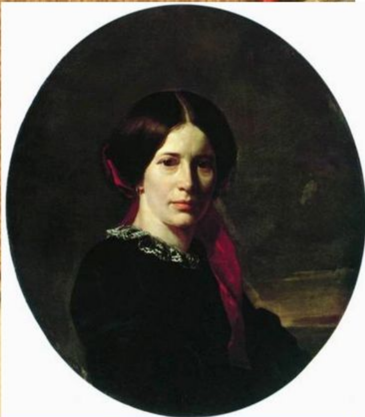
Работа художника Неврева Н. В.