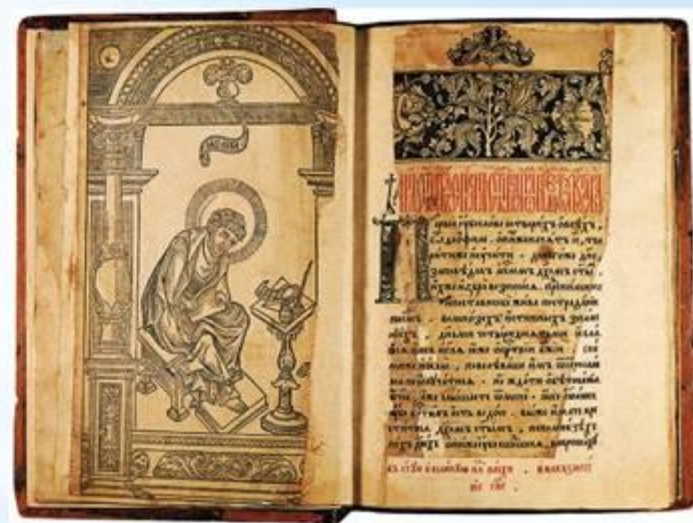
Первая печатная книга