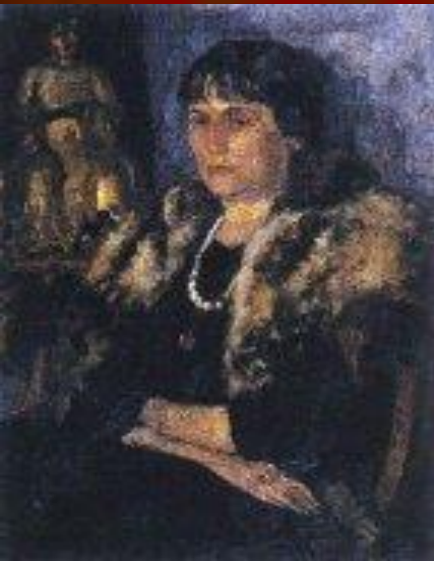
Портрет А.А. Ахматовой, Альтман