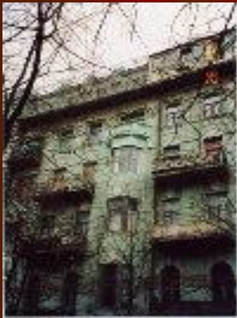
Ахматова в фонтанном доме