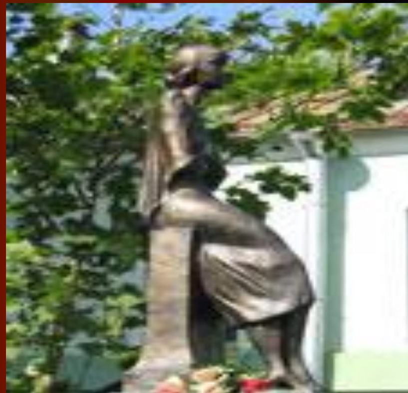
Памятник Ахматовой во дворе филфака Санкт -Петербург