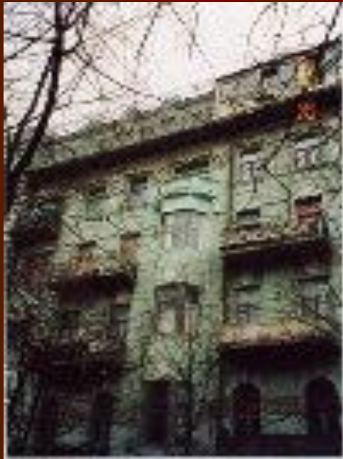
Ахматова в фонтанном доме