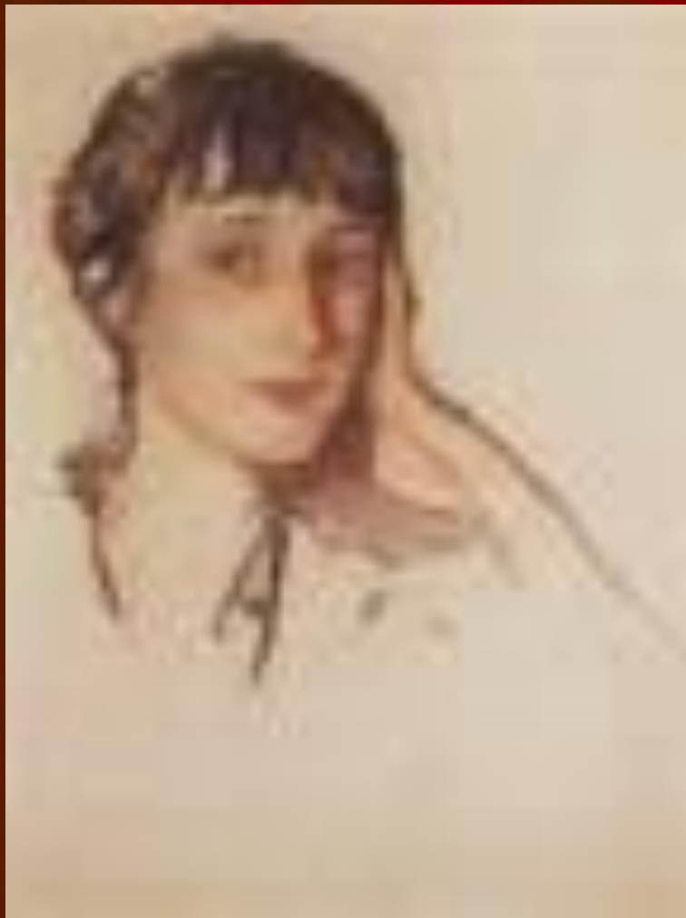
Портрет А.А. Ахматовой, 1922 г Е. Серебрякова