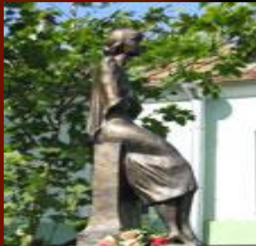
Памятник Ахматовой во дворе филфака Санкт -Петербург