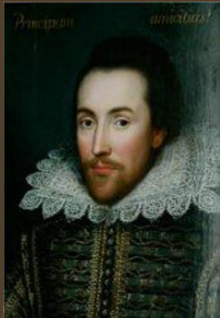
Прижизненный портрет Вильяма Шекспира 1610 год