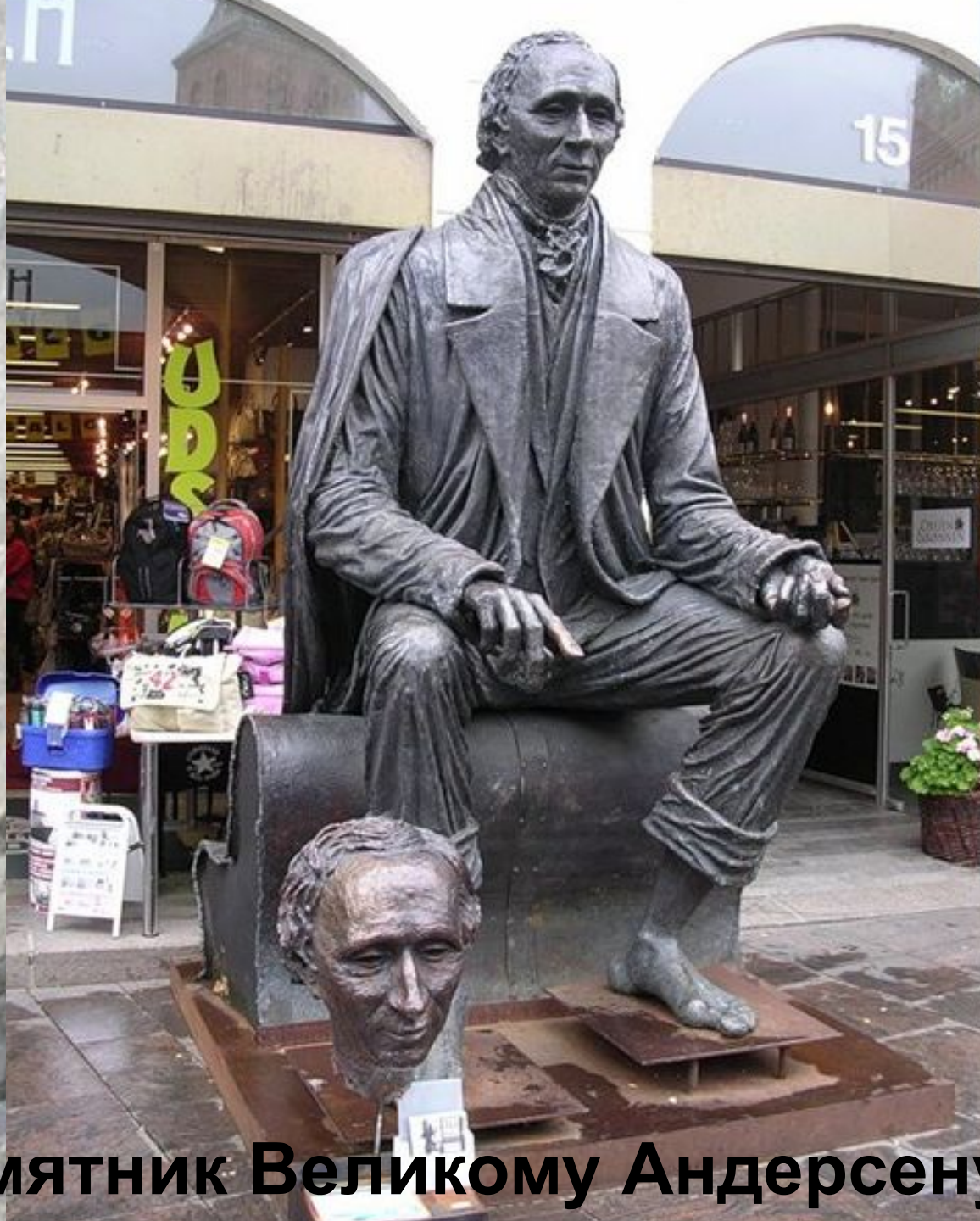
Памятник Великому Андерсену. Оденс