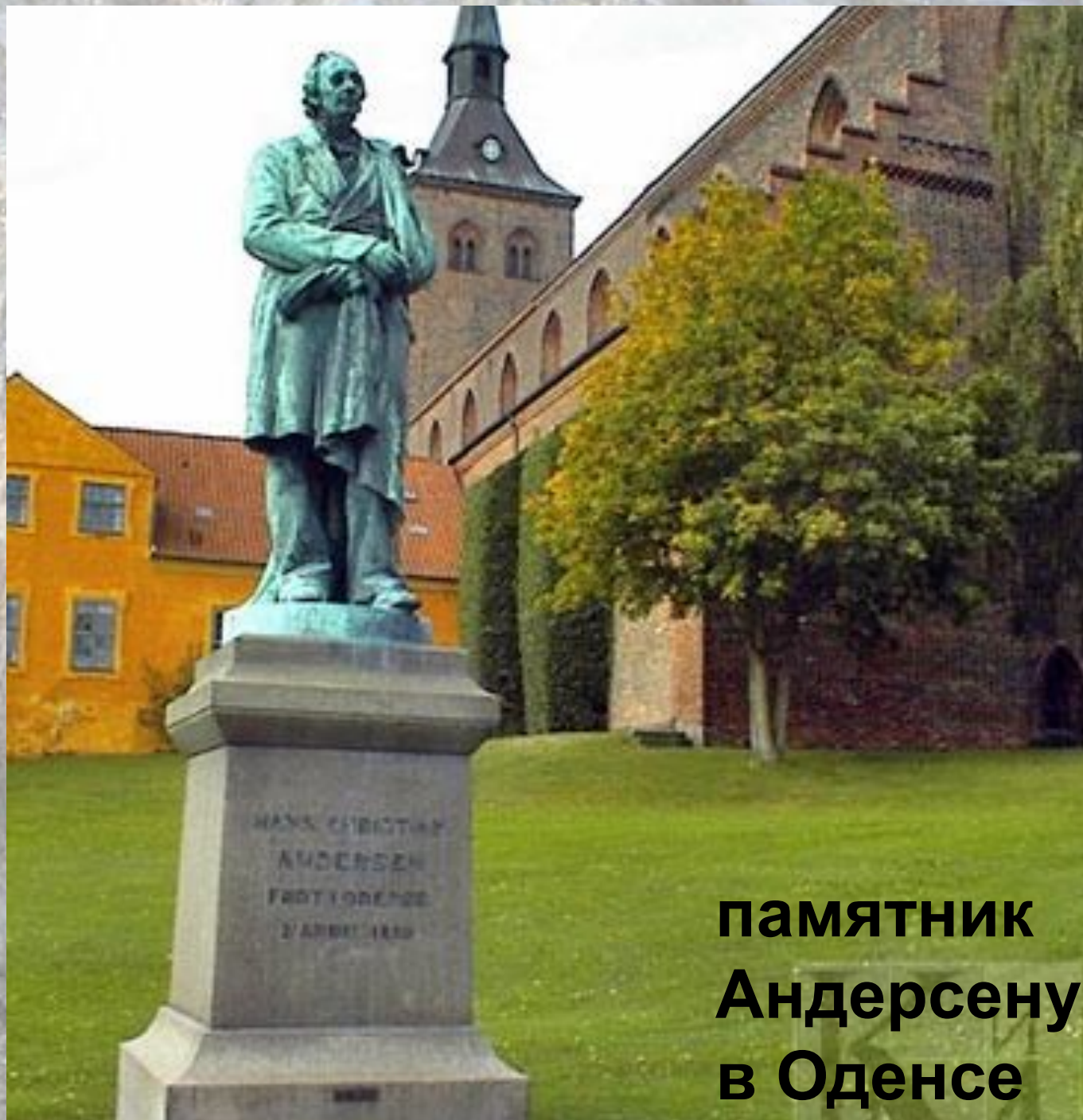
памятник Андерсену в Оденсе