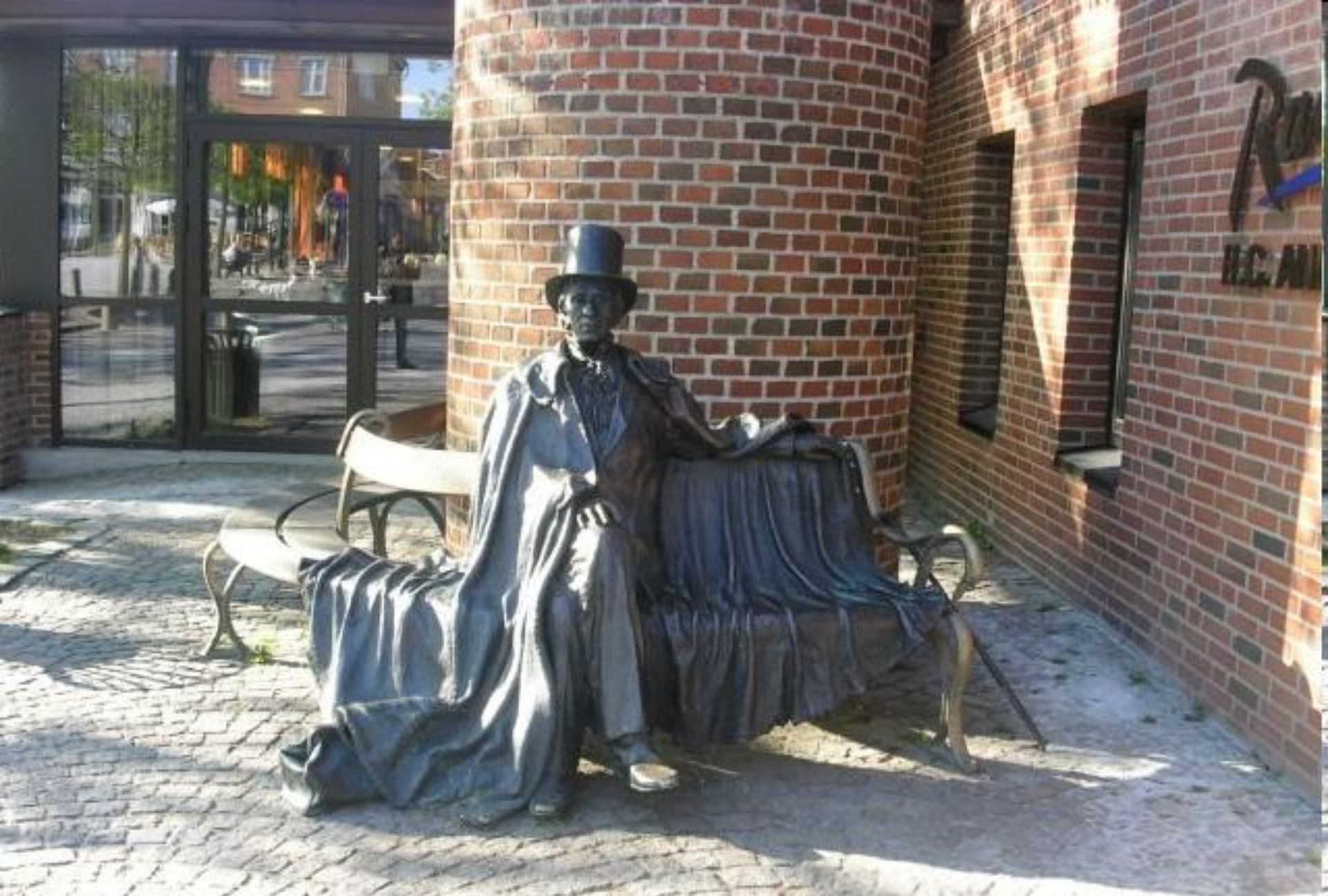
Оденс. Дом, где прошло детство Андерсена.