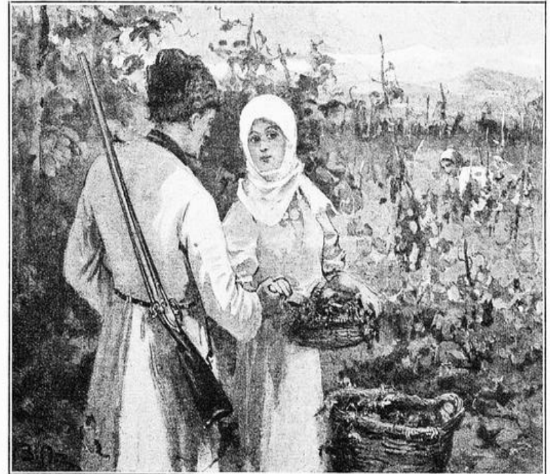
Руки их столкнулись. Оленья взяла ее руку, а она, ушибаясь, глядела на него. (Гл. стр. 146).