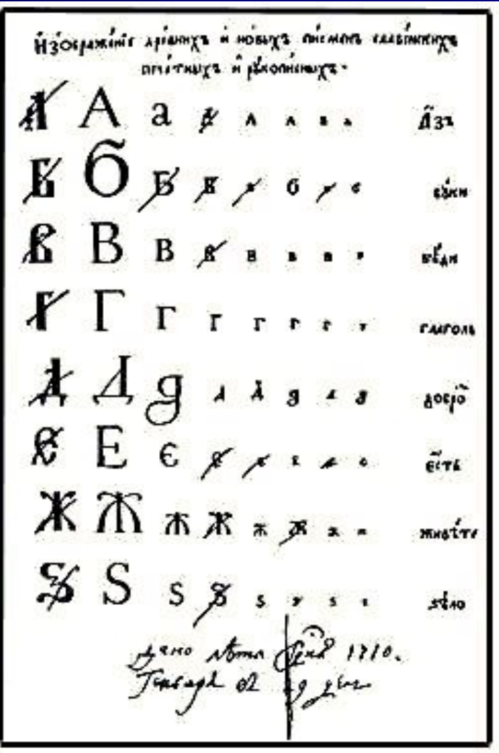
Гражданское письмо Начала 18 века

Писма Гдѣ присланыя сноротней гонца ѡжизѣ Тригоря долготында исполши нѡграмма брѣса Послалъ итѣст Гдѣнъ чрезъ почтѣ ради издѣтѣя, Пашѣ нандѣта матѣтеда поторѣе прѣдезенѣ чрезъ устандѣннѣу снленинѣу почтѣу.