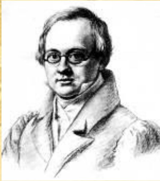
Антон Антонович Дельвиг