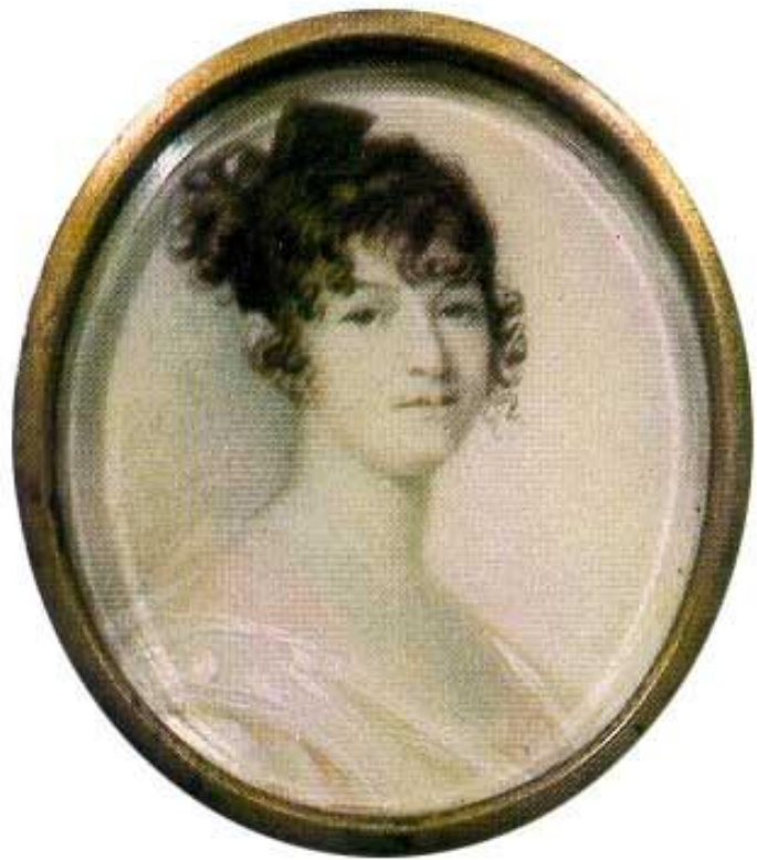
Н.О. Пушкина. 1800-е гг.

Мать, Надежда Осиповна , приходилась внучкой арапу Петра I, впоследствии русскому генералу Ганнибалу.