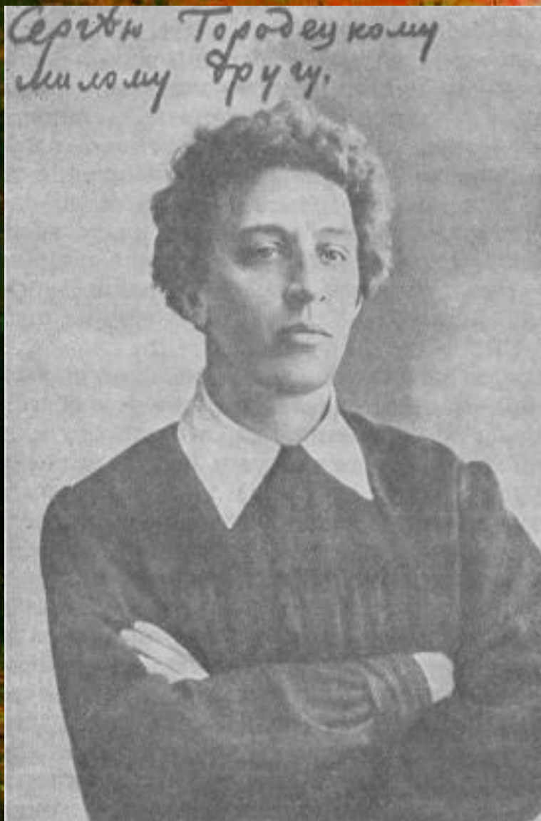
• А. Блок Фотография 1907