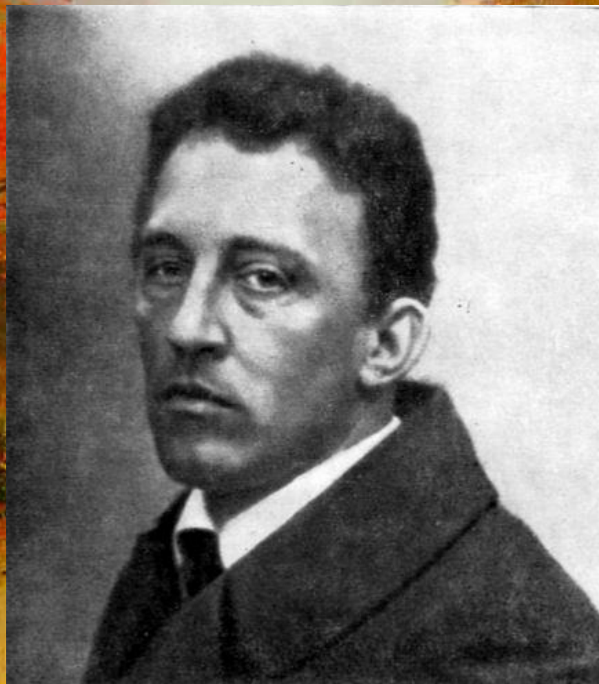
• А. Блок Фото. 17 июня 1916 г.