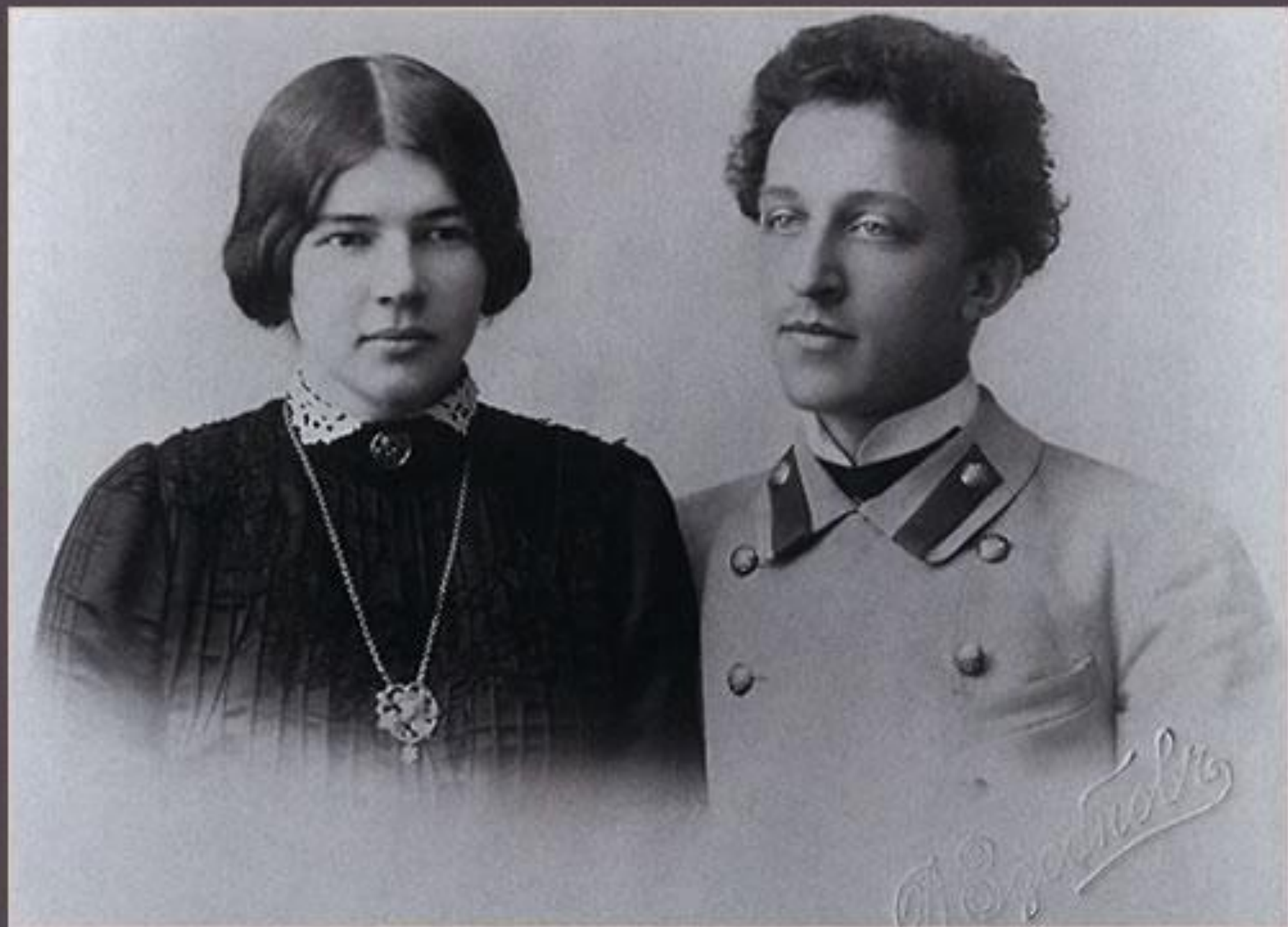
Венчальная фотография, 1903 г.