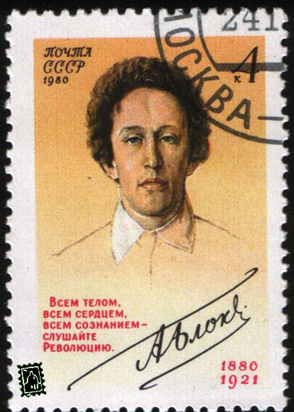
Марка СССР, посвящённая Блоку, 1980 год