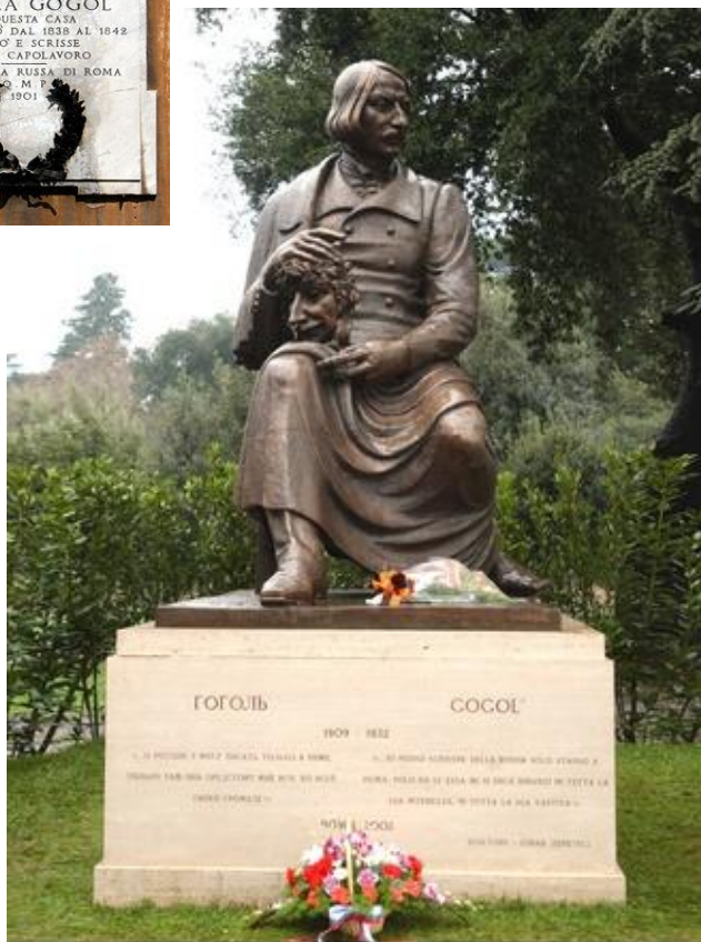
ПАМЯТНИК Н.В.ГОГОЛЮ, РИМ (ИТАЛИЯ), БРОНЗА, МЕДЬ, ВЫСОТА – 2,8 МЕТРА. MONUMENT TO N.V. GOGOL, ROME (ITALY), BRONZE, COPPER, 2.8M HIGH.

• 2002 Памятник Н.В.Гоголю (высота 2,8 м) установлен на вилле Боргезе, Рим