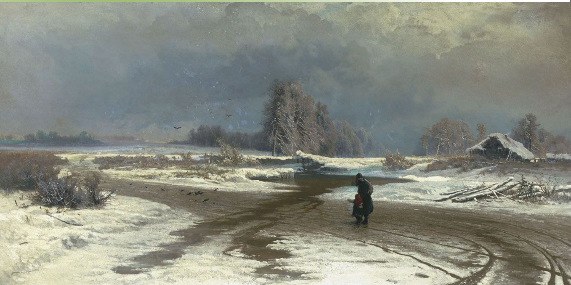
Ф. А. Васильев. «Оттепель». 1871