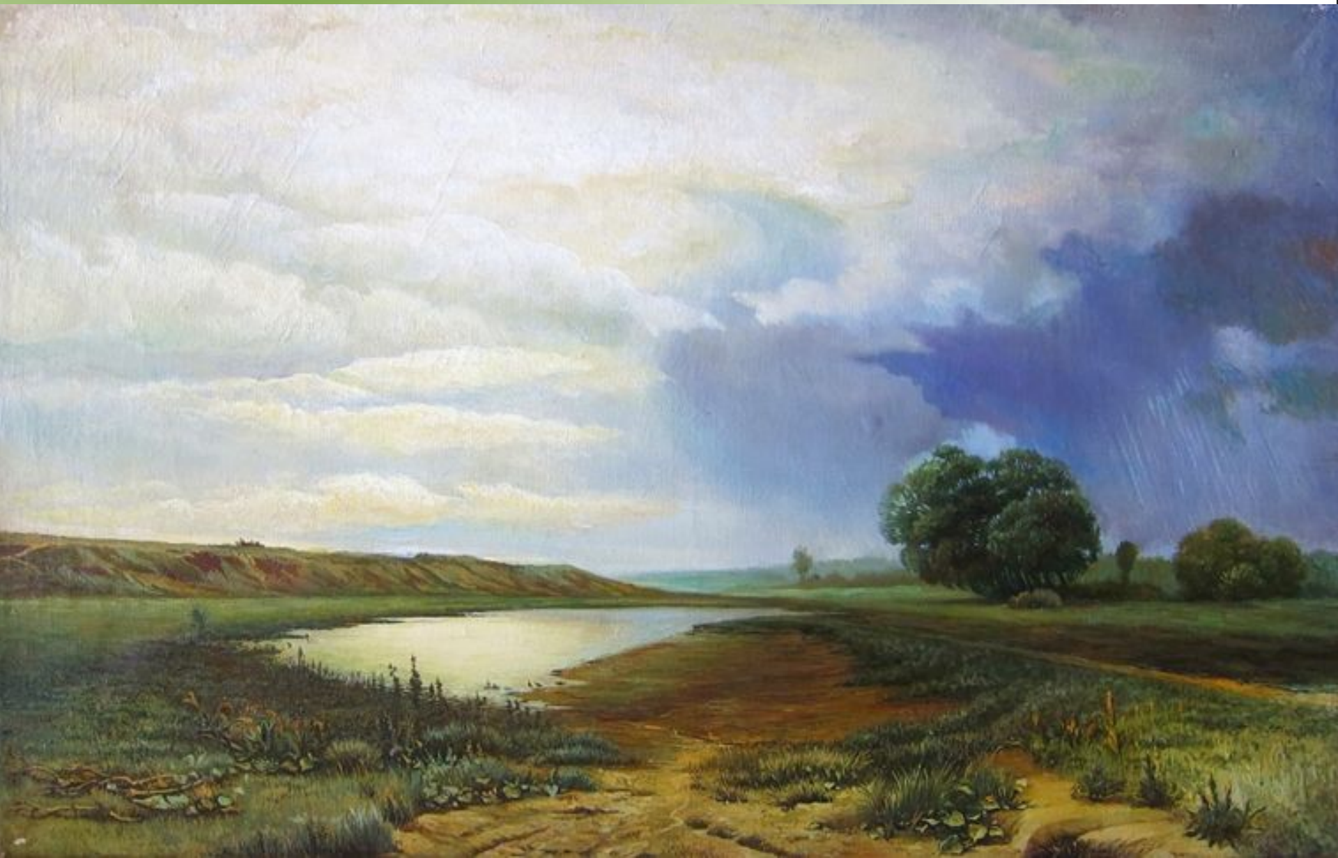
Ф. А. Васильев. «Мокрый луг». 1872