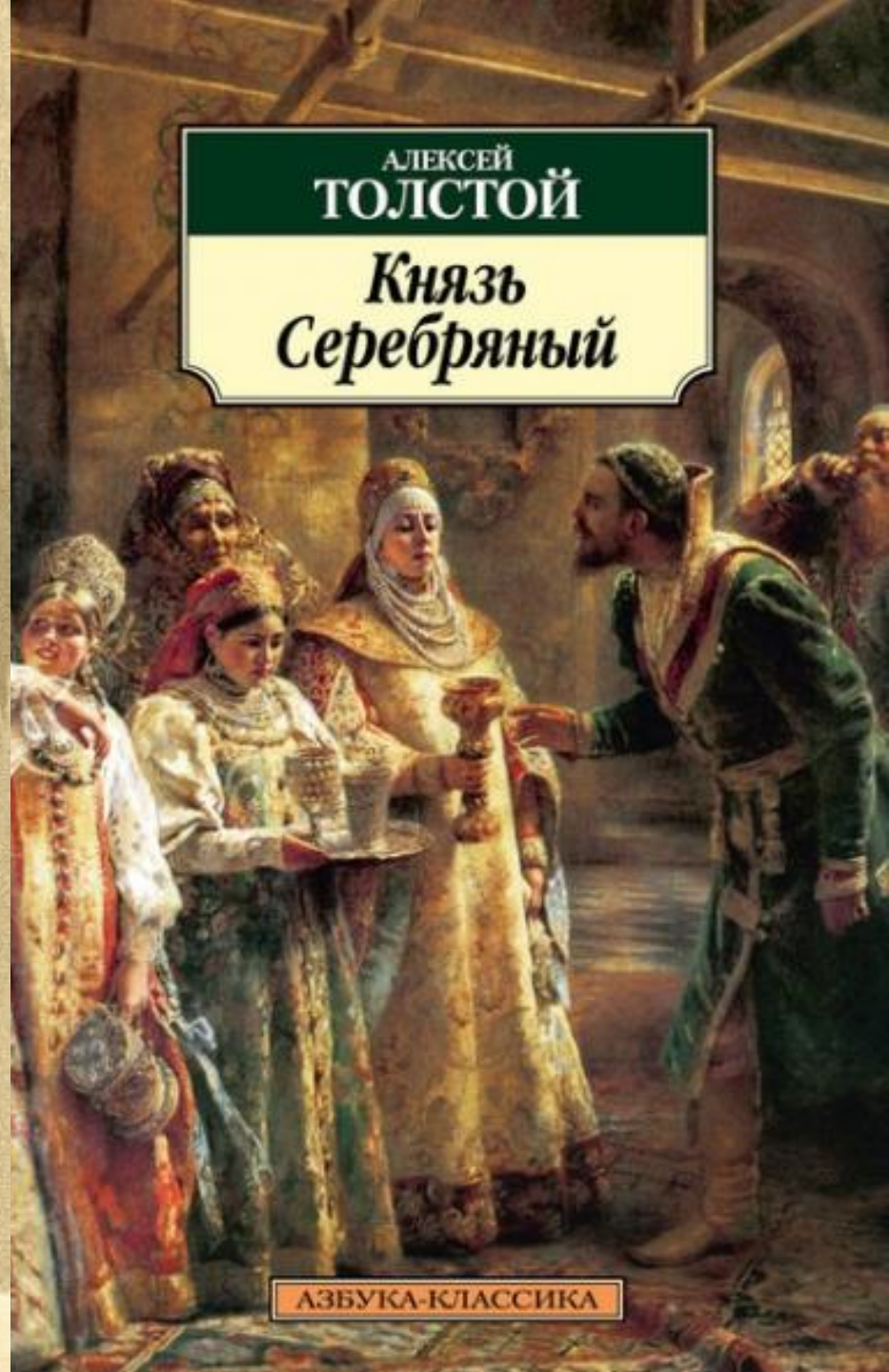
Алексѣй Константиновичъ Толстой.