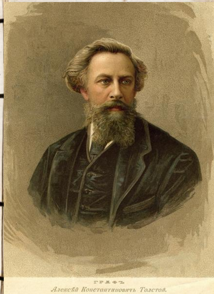
Алексей Константинович Толстой.

Дворянский класс по-прежнему стремился сохранить свое господство, хотя и внутри его не было единства. В страхе перед революцией «снизу» господствующим классом было ликвидировано крепостное право, но социальные проблемы решены не были. Сама эпоха требовала от искусства активного участия в борьбе за утверждение ясного общественного идеала.