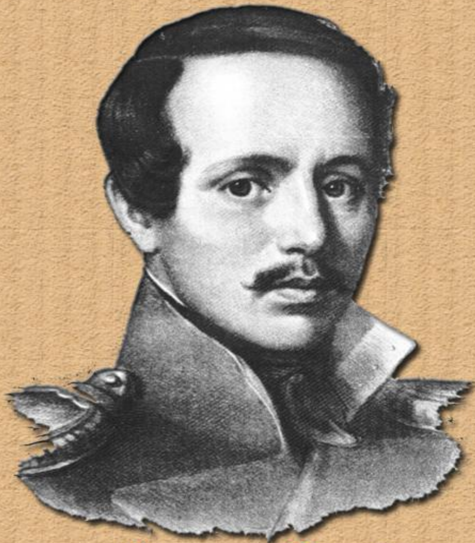
Михаил Юрьевич Лермонтов

Как и всякий настоящий, а тем более великий поэт, Лермонтов исповедовался в своей поэзии, и, перелистывая томики его сочинений, мы можем прочесть историю его души и понять его как поэта и человека.