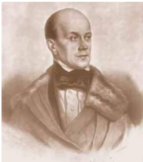
П. Я. Чаадаев

Любви, надежды, тихой славы Недолго нежил нас обман, Исчезли юные забавы, Как сон, как утренний туман; Но в нас горит еще желанье; Под гнетом власти роковой Нетерпеливою душой Отчизны внемлем призыванье. Мы ждем с томленьем упованья Минуты вольности святой, Как ждет любовник молодой Минуты верного свиданья. Пока свободою горим, Пока сердца для чести живы, Мой друг, отчизне посвятим Души прекрасные порывы! Товарищ, верь: взойдет она, Звезда пленительного счастья, Россия воспрянет ото сна, И на обломках самовластья Напишут наши имена!