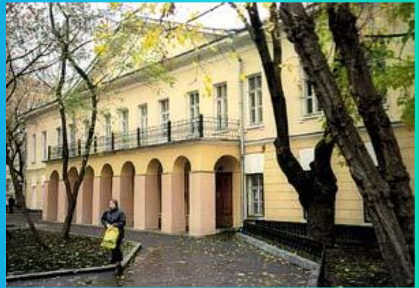
Дом №7 на Никитском бульваре. Здесь Гоголь прожил свои последние пять лет

Зиму 1847-1848 Гоголь проводит в Неаполе, усиленно занимаясь чтением русской периодики, новинок беллетристики, исторических и фольклорных книг — "дабы окунуться покрепче в коренной русский дух". В то же время он готовится к давно задуманному паломничеству к святым местам. В январе 1848 морским путем направляется в Иерусалим. В апреле 1848 после паломничества в Святую землю Гоголь окончательно возвращается в Россию, где большую часть времени проводит в Москве, бывает наездами в Петербурге, а также в родных местах — Малороссии.