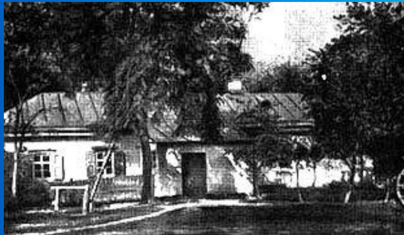
Дом доктора М.Я.Трохимовского в Сорочинцах, где родился Гоголь

У Гоголей было свыше 1000 десятин земли и около 400 душ крепостных. Предки писателя со стороны отца были потомственными священниками, однако уже дед Афанасий Демьянович оставил духовное поприще и поступил в гетмановскую канцелярию; именно он прибавил к своей фамилии Яновский другую — Гоголь, что должно было продемонстрировать происхождение рода от известного в украинской истории 17 в. полковника Евстафия (Остапа) Гоголя (факт этот, впрочем, не находит достаточного подтверждения).