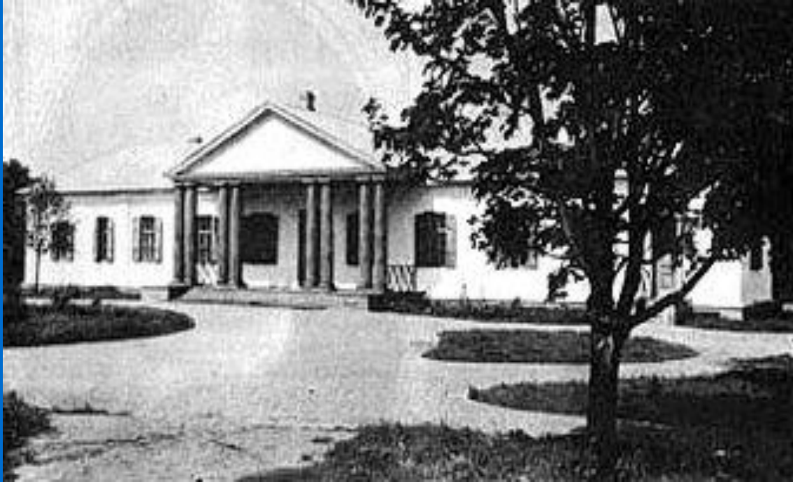
Родительский дом в Васильевке

Детские годы Гоголь провел в имении родителей Васильевке (другое название — Яновщина). Культурным центром края являлись Кибинцы, имение Д. П. Трощинского (1754-1829), дальнего родственника Гоголей, бывшего министра, выбранного в поветовые маршалы (в уездные предводители дворянства); отец Гоголя исполнял у него обязанности секретаря. В Кибинцах находилась большая библиотека, существовал домашний театр, для которого отец Гоголь писал комедии, будучи также его актером и дирижером.