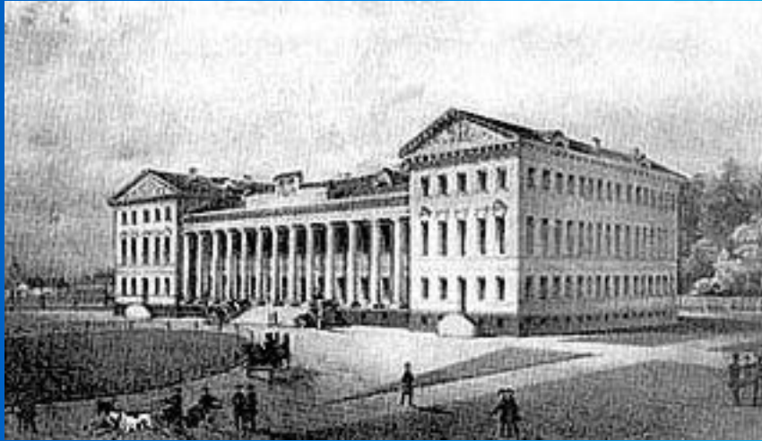
Нежин. Гимназия высших наук

В 1818-19 Гоголь вместе с братом Иваном обучался в Полтавском уездном училище, а затем, в 1820-1821, брал уроки у полтавского учителя Гавриила Сорочинского, проживая у него на квартире. В мае 1821 поступил в гимназию высших наук в Нежине. Здесь он занимается живописью, участвует в спектаклях — как художник-декоратор и как актер, причем с особенным успехом исполняет комические роли. Пробует себя и в различных литературных жанрах. Тогда же пишет сатиру "Нечто о Нежине, или Дуракам закон не писан" (не сохранилась).