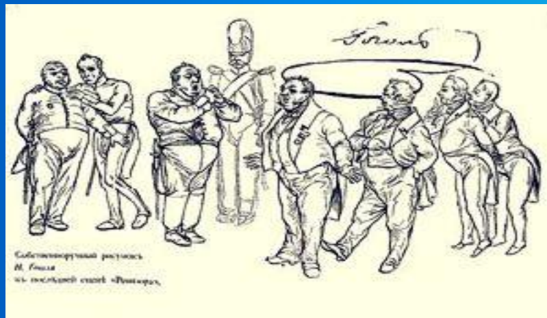
Собственнооручный рисунок Н.В. Гоголя к последней сцене "Ревизора"

Верх гоголевской фантастики — "петербургская повесть" "Нос" (1835; опубликована в 1836 г.), чрезвычайно смелый гротеск, предвосхитивший некоторые тенденции искусства XX в. Контрастом по отношению к и провинциальному, и столичному миру выступала повесть "Тарас Бульба", запечатлевшая тот момент национального прошлого, когда народ ("казаки"), защищая свою суверенность, действовал цельно, сообща и притом как сила, определяющая характер общеевропейской истории.