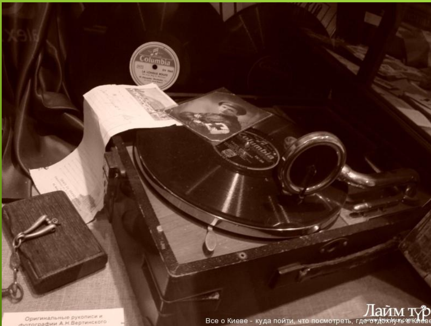
Оригинальные рукописи и фотографии А. Н. Вертинского