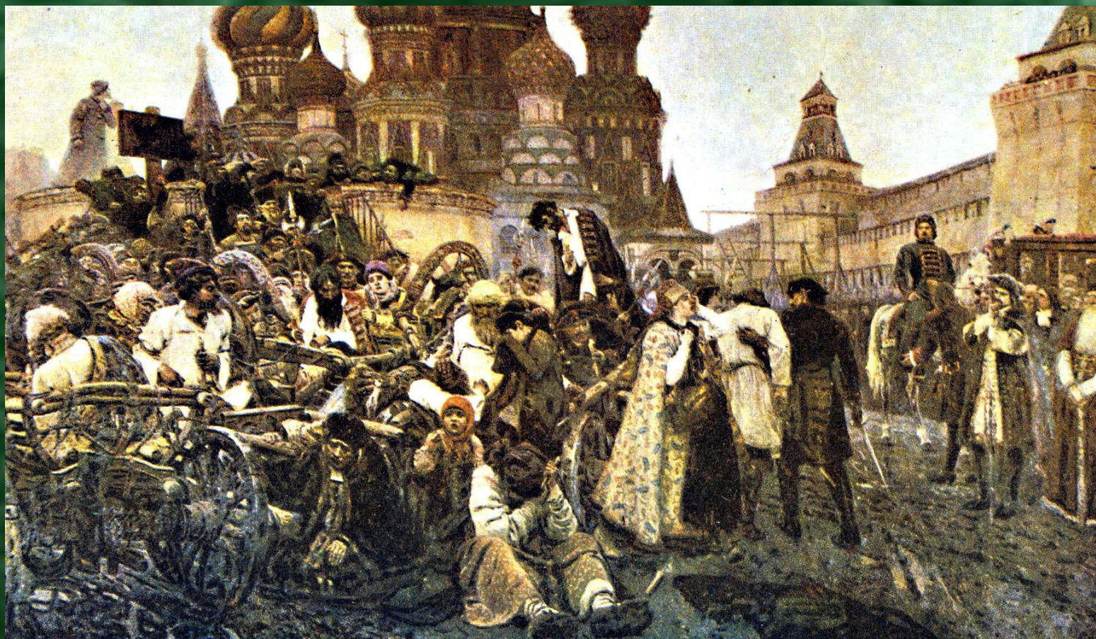
«Утро стрелецкой казни». В. Суриков.

Буду я, как стрелецкие жёнки, Под кремлёвскими башнями вить.