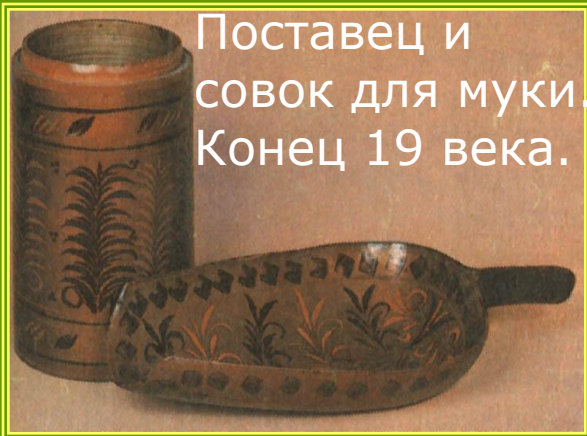
Поставец и совок для муки. Конец 19 века.

Украшая самые разные по форме изделия, хохломские художники проявили себя искусными декораторами. Расписывая чашку или блюдо, мастер чётко выделял дно, помещая в нем розетку, а от её центра, подобно солнечным лучам, разводил линии к краям предмета. По стенкам чашки наносил узор - осочку — из косых чёрных и красных мазков. Они напоминали собой стебли травы, как бы склонившейся от порыва ветра. На поставцах — сосудах цилиндрической формы — художники рисовали вертикальные побеги — древа. Чередуясь между собой по цвету— два черных и два красных,— деревца с узорной листвой как бы тянутся веточками к свету, к солнцу. Располагали каждое растение свободно, так, чтобы ни один стебелёк не касался другого, чтобы каждая веточка привольно раскинула свои листья. В этих поэтических рисунках отразилась любовь русского человека к природе.