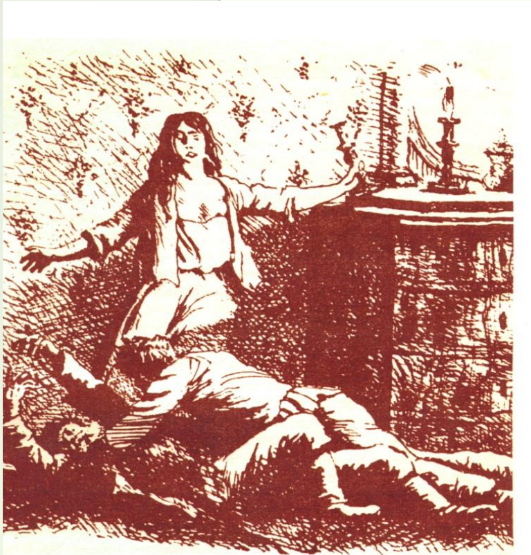
Художник Б. Кустодиев