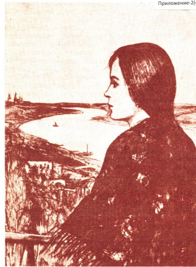
Иллюстрация И. Глазунова