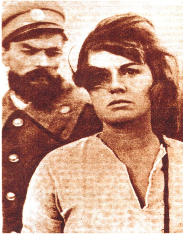
Кадр из фильма «Сибирская леди Макбет»

Режиссер: поляк Анджей Вайда. Фильм снят в Югославии в 1961 г.