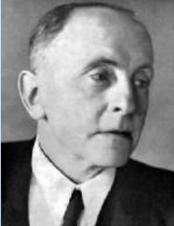
• М. Фасмер