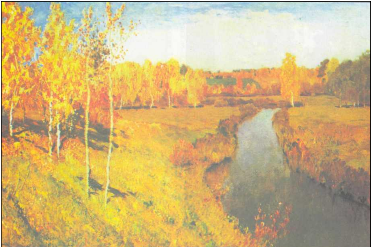
И.И. Левитан «Золотая осень»