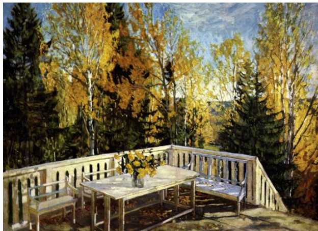
С.Ю. Жуковский «Осень. Веранда»