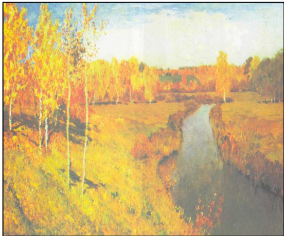
И.И. Левитан «Золотая осень»