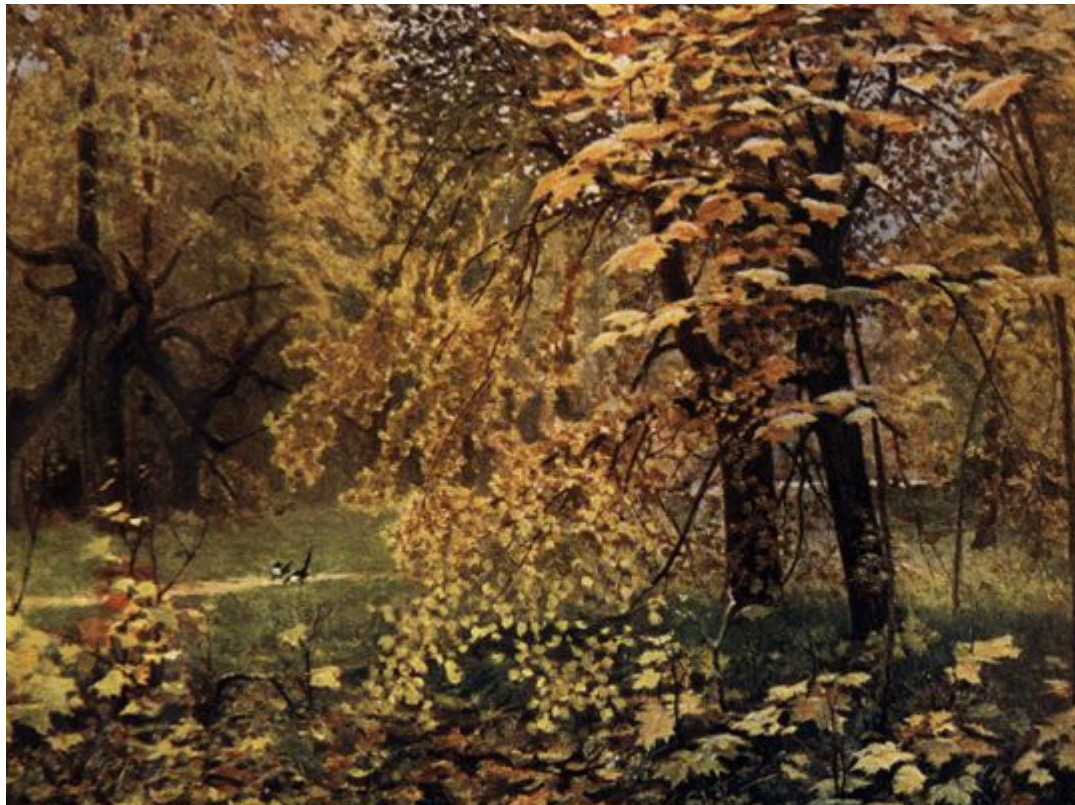
И.С. Остроухов «Золотая осень»