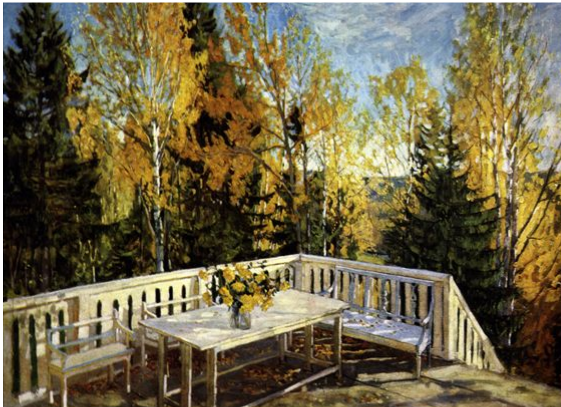
С.Ю. Жуковский «Осень. Веранда»