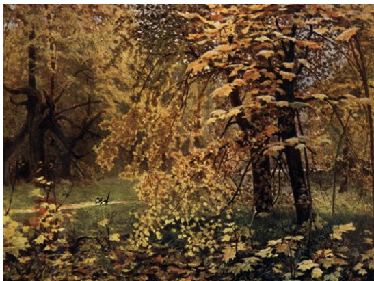
И.С. Остроухов «Золотая осень»