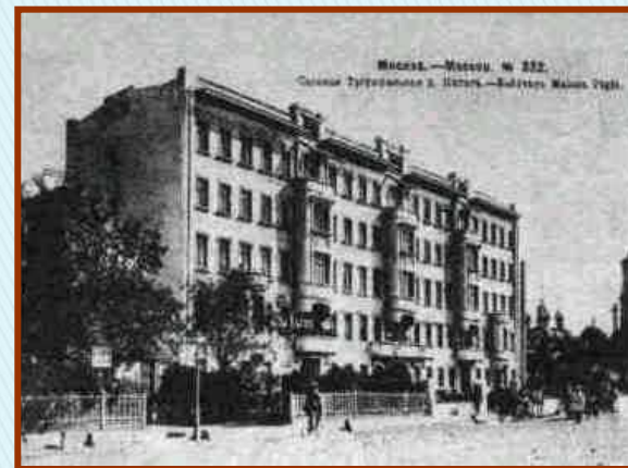
Дом в Москве, где Булгаков жил с 1921 по 1924 годы

Над романом писатель начал работать в 1922 - 1923 годах. Автор, согласно воспоминаниям современников, намеревался создать трилогию о Гражданской войне, но замысел не был реализован: написана только I часть трилогии «Белая гвардия»