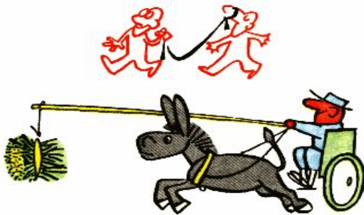
Водить за нос