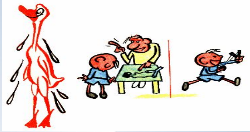
Как с гуся вода