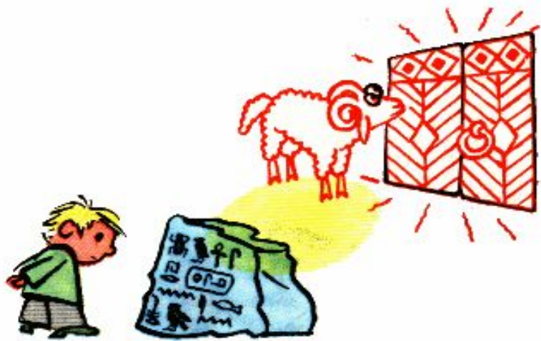
Смотреть как баран на новые ворота