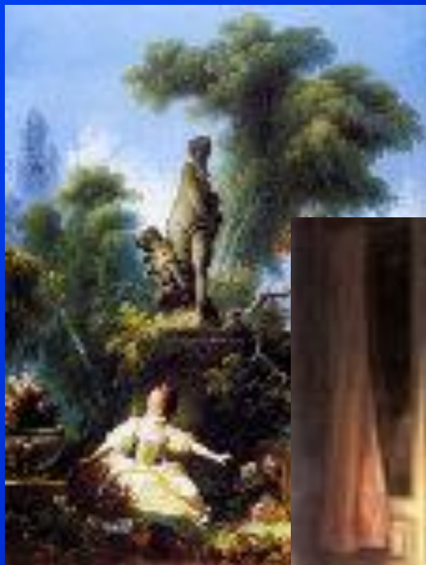
«Встреча в парке»