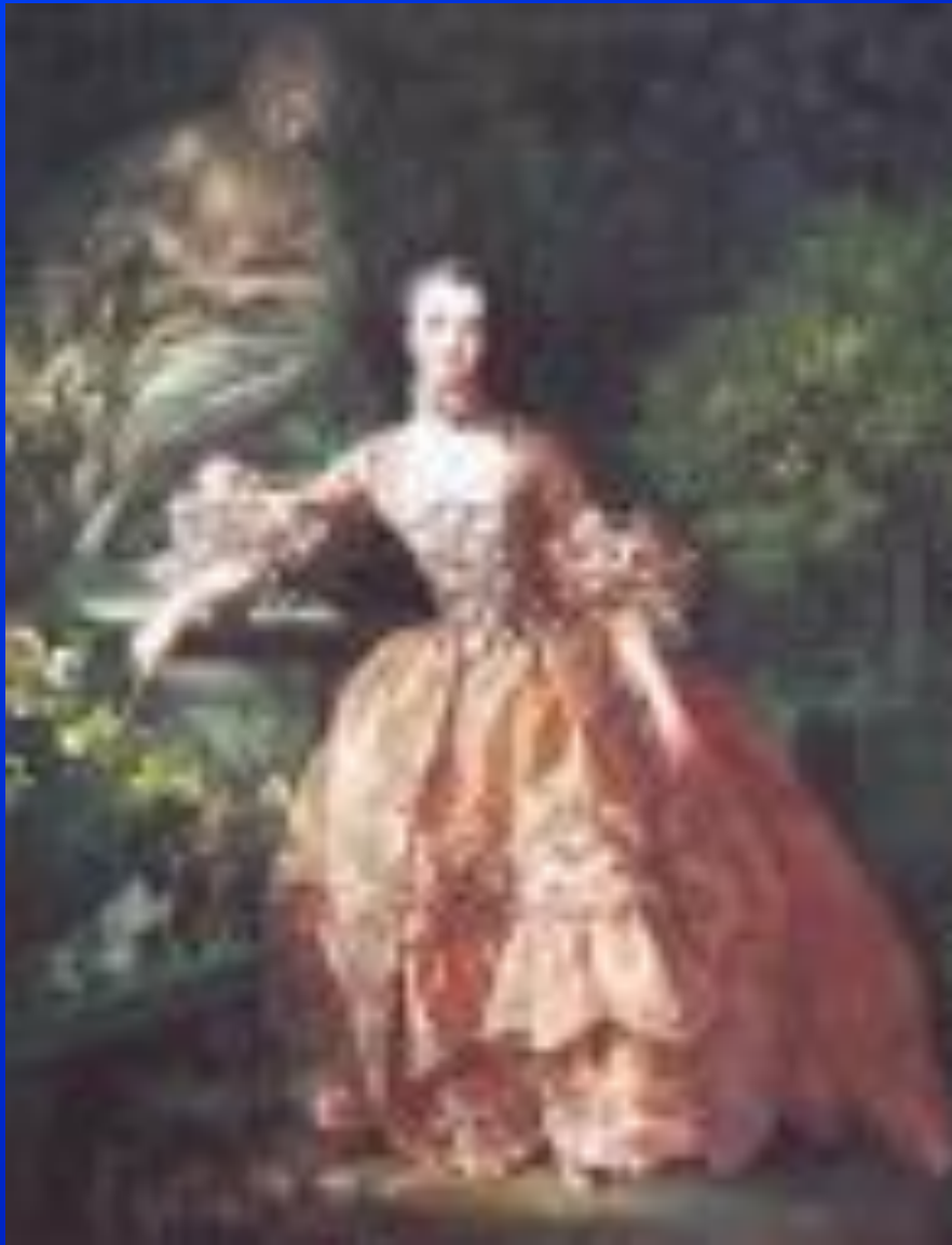
«Портрет мадам де Помпадур»