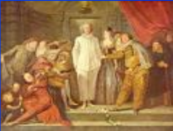
«Актеры на итальянской сцене»