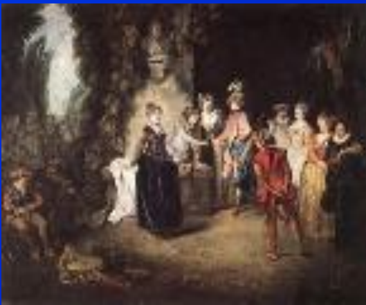
«Актеры во французском театре»