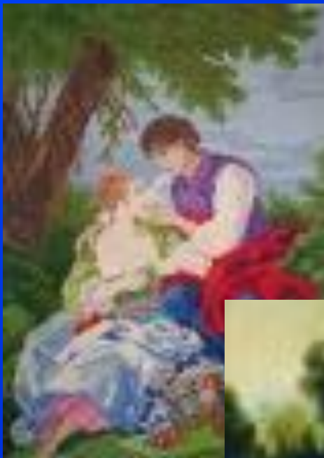
«Вышивка с картинами»