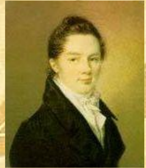
Иван Иванович Пуцин

Пушкин сохранил лицейскую дружбу и культ Лицея на всю жизнь.