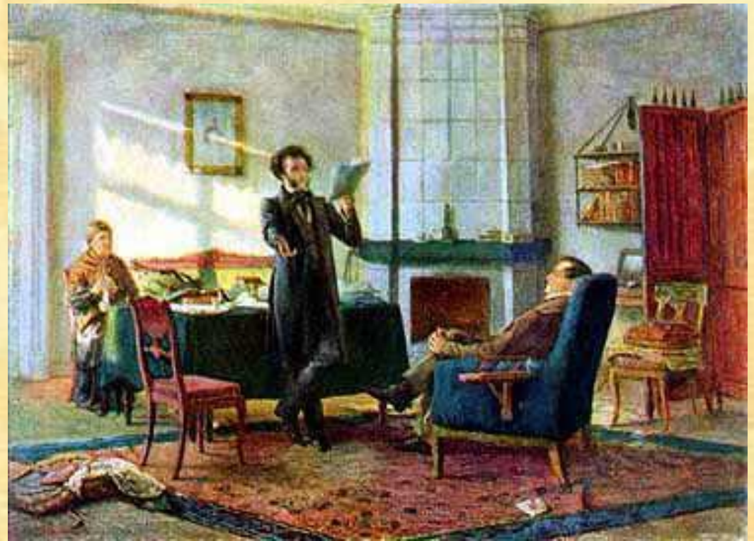
Пушкин в селе Михайловском (Пушкин у Пушкина). Н.Н. Ге. 1875 г.

За три года ссылки написаны "Кавказский пленник", "Бахчисарайский фонтан", а также "Узник", "Песнь о Вещем Олеге». Начат роман в стихах "Евгений Онегин".