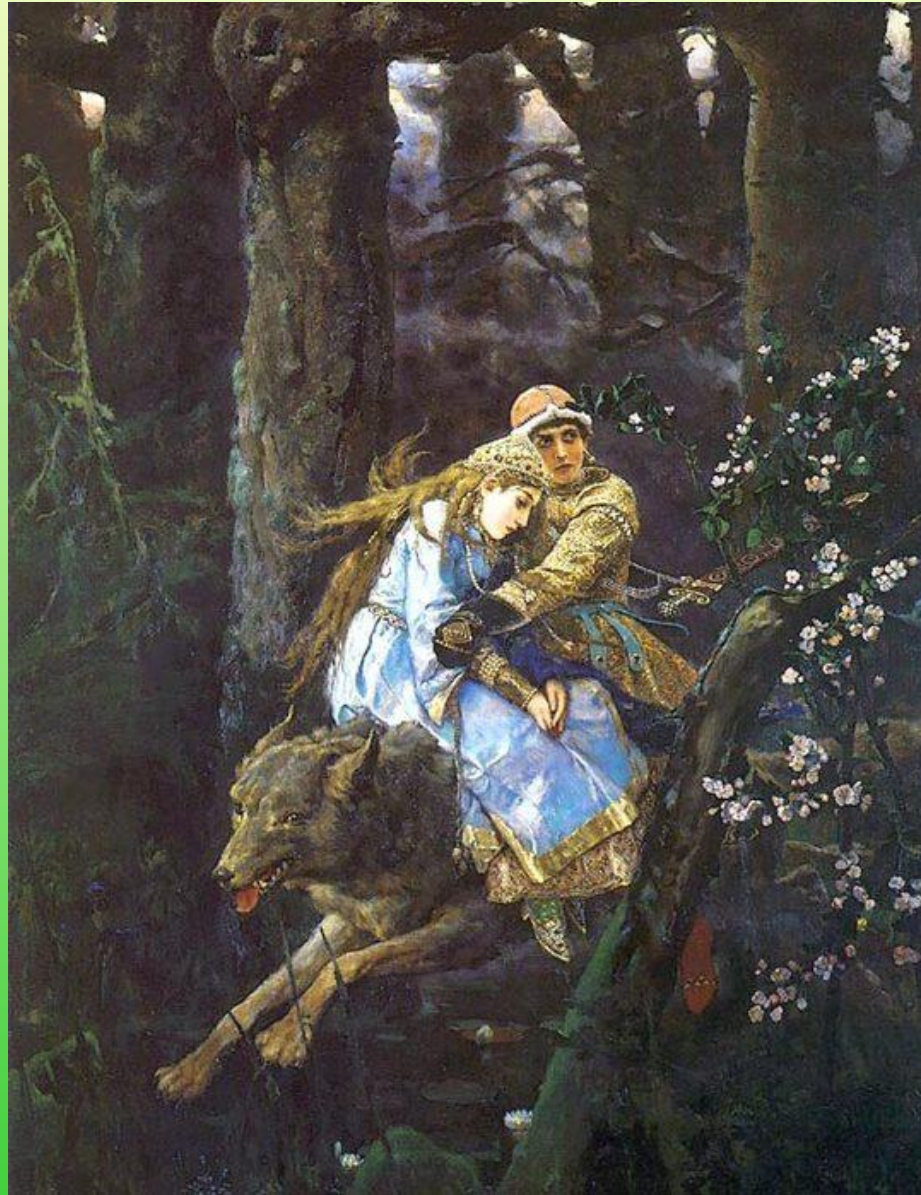
В.М.Васнецов «Иван-царевич на Сером волке», 1910г